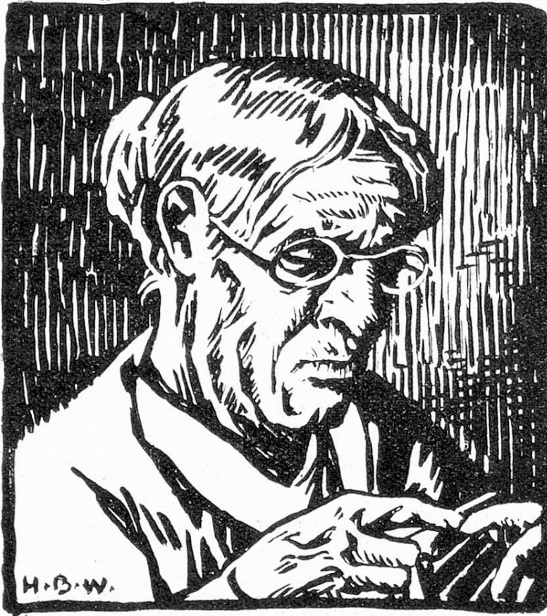
H. B. Wieland, Alte strickende Frau.