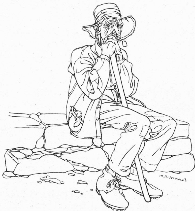
M. P. Verneuil, Vieillard assis.

sacrées aux vieillards ont atteint frs. 686,017.15 en 1923, alors qu'elles avaient été de frs. 462,721.80 l'année précédente. Il y a lieu d'ajouter à ces sommes celles qui ont été consacrées à des Asiles de Vieillards ou à d'autres institutions analogues, soit frs. 86,072.70. Les collectes cantonales se sont élevées d'une façon réjouissante de frs. 565,015.67 en 1922 à frs. 617,915.62 en 1923. Malheureusement le produit de ces collectes n'a pas couvert les dépenses qui ont atteint le total de frs. 772,089.85, de sorte que nous nous trouvons en présence d'un déficit de frs. 154,174.23 qui a dû être prélevé sur les petites réserves constituées.