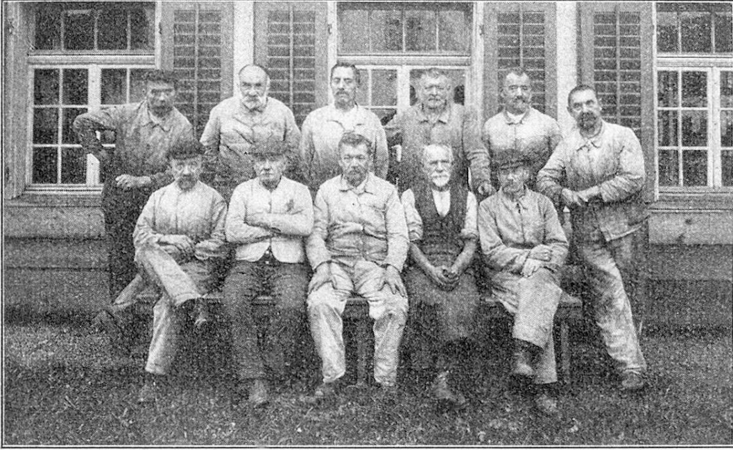
Die Arbeiter der Alterswerkstatt. L'équipe de l'atelier pour ouvriers âgés.

ändern später ein. Jeder erhält den gleichen Stundenlohn, den er in seiner frühern Stellung bezog. Mit Rücksicht auf das Alter ist jedoch die Arbeitszeit verkürzt worden und dauert von 8—12 Uhr vormittags und 1\frac{1}{4} —5 Uhr nachmittags, Samstags von 8— 11\frac{1}{4} Uhr vormittags.