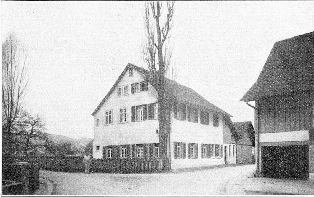
Außenansicht der Alterswerkstatt. Extérieur de l'atelier pour ouvriers âgés.

erklärlich, daß sie eine verhältnismäßig große Zahl alter Arbeiter beschäftigt, welche dreißig, vierzig und mehr Jahre in ihrem Dienste gestanden haben und sich völlig mit dem Geschäfte verwachsen fühlen. In einem solchen Großbetriebe ist es für die älteren Arbeitskräfte natürlich besonders schwer, mit der Entwicklung der Technik Schritt zu halten, und es erweist sich mit Rücksicht auf ihre persönliche und die Betriebssicherheit früher oder später als notwendig, sie von ihrer Arbeitsstelle wegzunehmen. Was soll nun mit ihnen geschehen? Ein Teil von ihnen läßt sich pensionieren, viele wehren sich aber dagegen: sie fühlen sich noch rüstig und leistungsfähig, ihr Stolz, ihre Berufsehre bäumt sich dagegen auf, zum alten Eisen geworfen zu werden. Da gilt es nun, irgendwo im Betrieb ein „Pöstlein“ ausfindig zu machen, das der Aus-rangierte noch versehen kann: Bedienung eines Aufzuges, Ausgabe von Zeichnungen und Werkzeugen, Verwendung als Nachtwächter, im Archiv, in der Lichtpausabteilung u.s.w.