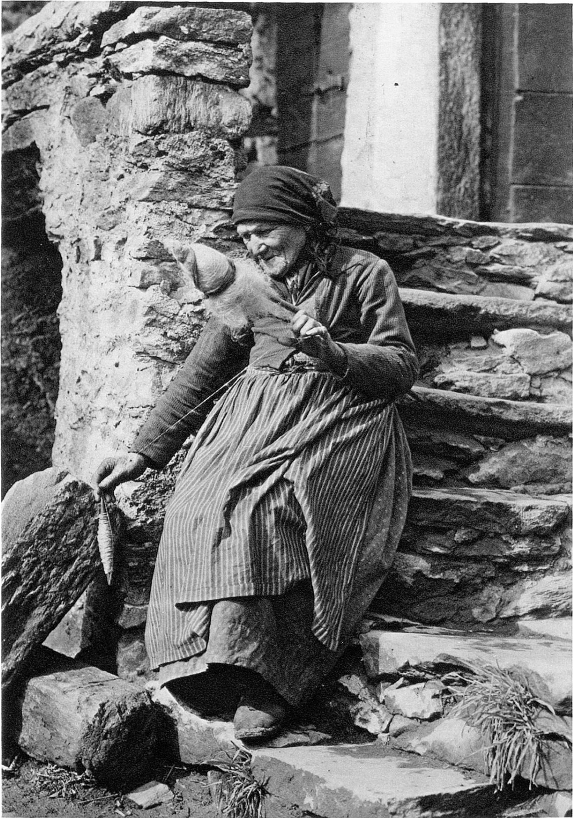
Vecchia contadina † a Brione (Ticino)