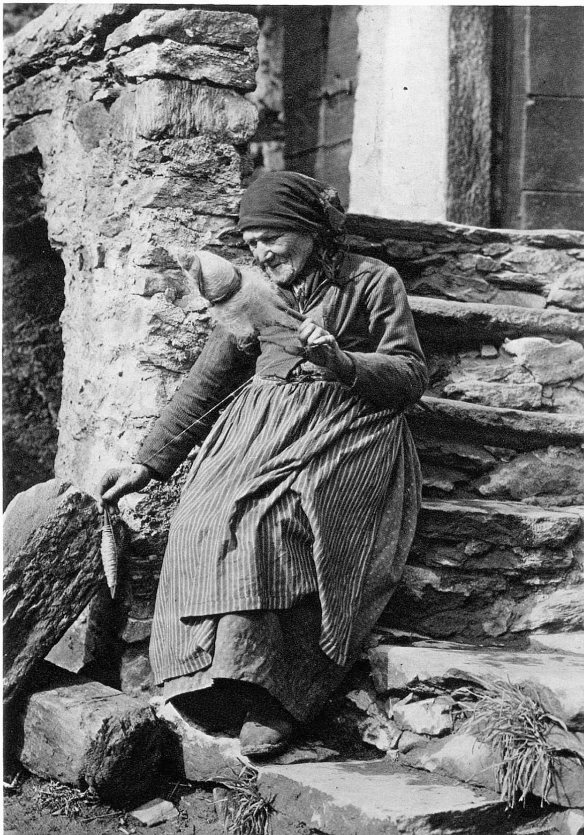
Vecchia contadina † a Brione (Ticino)