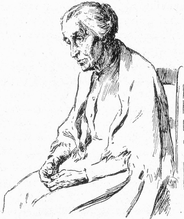
F. Müller-Münster, Greisin — Vieille femme.

Aus dem Wohlwollen für die Greise und Greisinnen heraus ist ja auch die Stiftung „Für das Alter“ entstanden und fließen Jahr für Jahr die freiwilligen Beiträge in ansehnlicher Zahl. Und wenn man sich erinnert, mit welcher Wucht das Schweizervolk für den Verfassungsartikel, der die Altersversicherung bringen soll, eintrat, so wird man