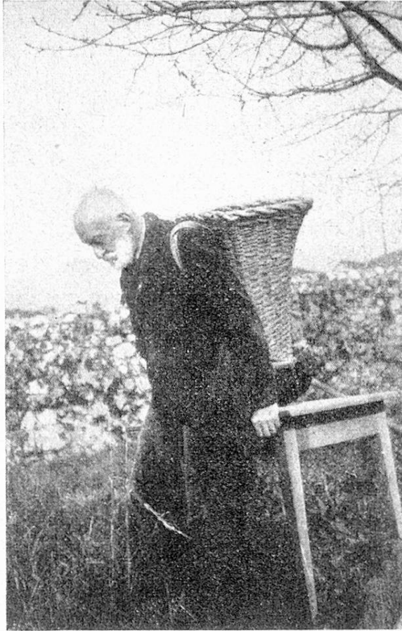
Vétérans du travail: Dr. A. Forel, intellectuel octogénaire retourné à la terre.

Es wurde schon erwähnt, daß die K o s t e n f ü r d e n P f l e g e t a g in einem solchen Heim, wie die geschilderten, nicht größer oder sicher nicht viel größer sind als in einer Anstalt mit vielleicht einigen hundert Insassen. Die bürgerliche Armenpflege der Stadt Zürich hat in ihren 3 Altersheimen im Jahre 1925, alles — außer die Verzinsung des Anlagewertes — inbegriffen, auf den Pflegling in Uster Fr. 2.91, im Lilienberg Fr. 2.94, und in Erlenbach Fr. 2.93 pro Tag auslegen müssen. Wenn allerdings solche Heime noch abbezahlt und verzinst werden müssen, erhöhen sich die Kosten des Pflagetages. Es sollte darum überall, wo man an die Schaffung solcher Heime denkt, darauf Bedacht genommen werden, möglichst die Mittel zur vollständigen Deckung der Anlagekosten zu beschaffen oder dann wenigstens eine rasche Abzahlung der verbleibenden Schulden vorzunehmen.