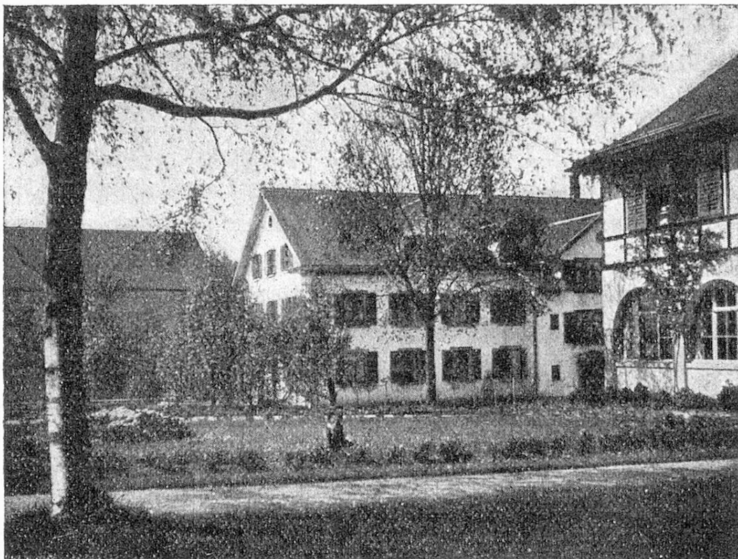
Städtisches Altersheim Rosengarten Uster.

und der freiwilligen Armenpflege Zürich hat man neben einer kleineren Zahl von Einerzimmern meist Zweierzimmer, nur ausnahmsweise ist ein Zimmer für 3 oder höchstens 4 Personen eingerichtet.