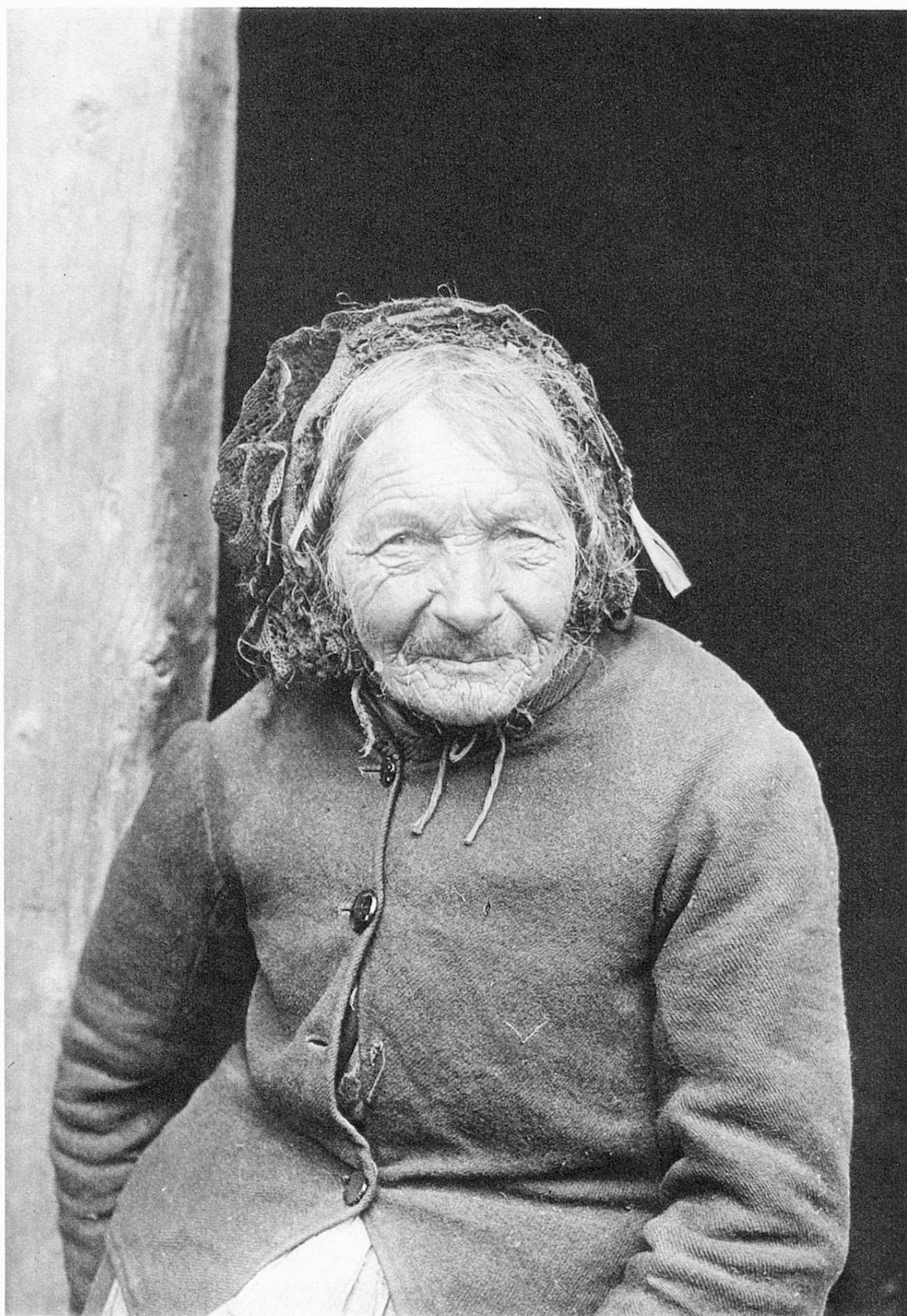
Insassin † des Armenhauses von Marmels (Graubünden) Pensionnaire † de la Maison des pauvres de Marmorera (Grisons)