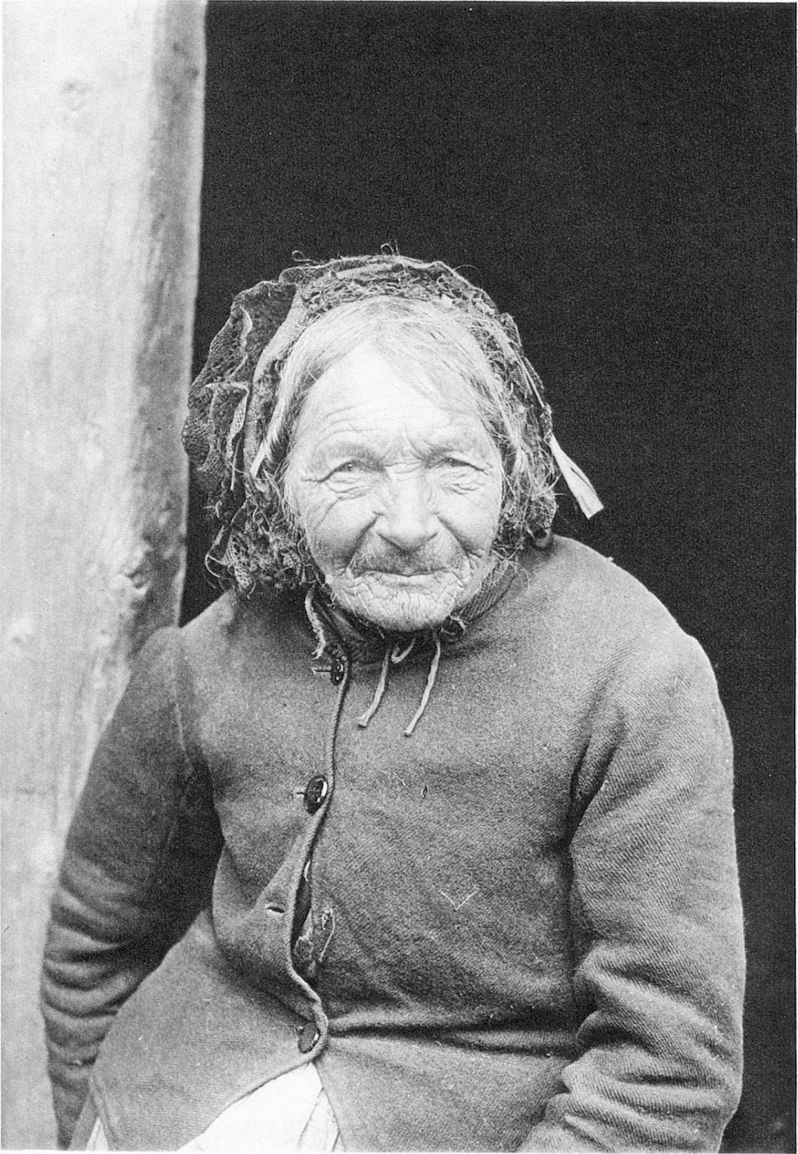
Insassin † des Armenhauses von Marmels (Graubünden) Pensionnaire † de la Maison des pauvres de Marmorera (Grisons)