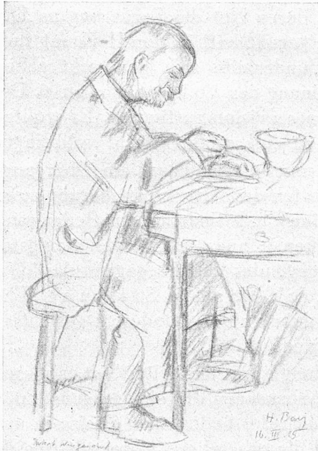
Alter Knecht beim Essen. Vieux domestique au repas.

rische Volksversicherung mit einheitlicher Regelung ist nur auf der Basis sehr niedriger Prämien- und Rentenansätze, welche den einfachen Lebensverhältnissen der Bevölkerung der Gebirgsgegenden angemessen sind, möglich. Auf dieser Grundlage würden dann kantonale, Betriebs- und andere Versicherungskassen allen oder einzelnen Bevölkerungsschichten eine Zusatzversicherung bie-