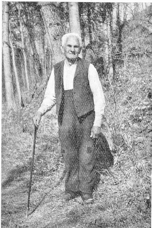
Der älteste Schützling in Appenzell.

rück. „Meine Kinder tun jetzt noch für mich, was sie können, und das haben sie noch von der Mutter selig gelernt. 's ist etwas Schönes, beteuert der Heiri, wenn eine Familie zusammenhält.“ Als weiter Verwandter eines leider früh verstorbenen Schweizerdichters meinte er: „Hätte der eine Pension gehabt wie ich, — sie ist nicht groß, aber für mich langt's ungefähr, — dann wär's ihm