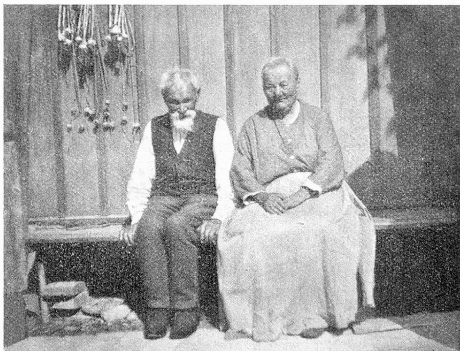
Altes Thurgauerpaar, sie blind, er taub.

Lebzeiten nicht gestattet, denn du gehörtest zu den Stillen im Lande. Jetzt aber schaust du mir vielleicht von oben her lächelnd zu und lässest mich freundlich gewähren. — Man hatte mir von einer alten Weberin gesagt, die in sehr dürftigen Verhältnissen im Logierhaus einer Fabrik lebe. Ich fand ein ärmliches Stübchen, dessen einzige Schönheit in einem freien Blick auf Wiese und Wald und auf einen weiten Himmel bestand. Und in dem Stübchen ein kleines,