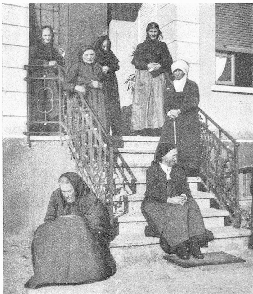
Vecchie donne all'uscio del ricovero Gordola e Valle Verzasca. Alte Frauen vor dem Altersasyl Gordola-Val Verzasca.

Per esempio, l'assemblea dei delegati della fondazione „Per la vecchiaia“ del 5 Novembre 1919, come prima donazione decise, con lieta unanimità, una sovvenzione di Fr. 20,000 da prelevarsi dalla cassa centrale dell' appena costituita Fondazione, da versare ai vecchi cantoni per l'erezione di case per la vecchiaia.