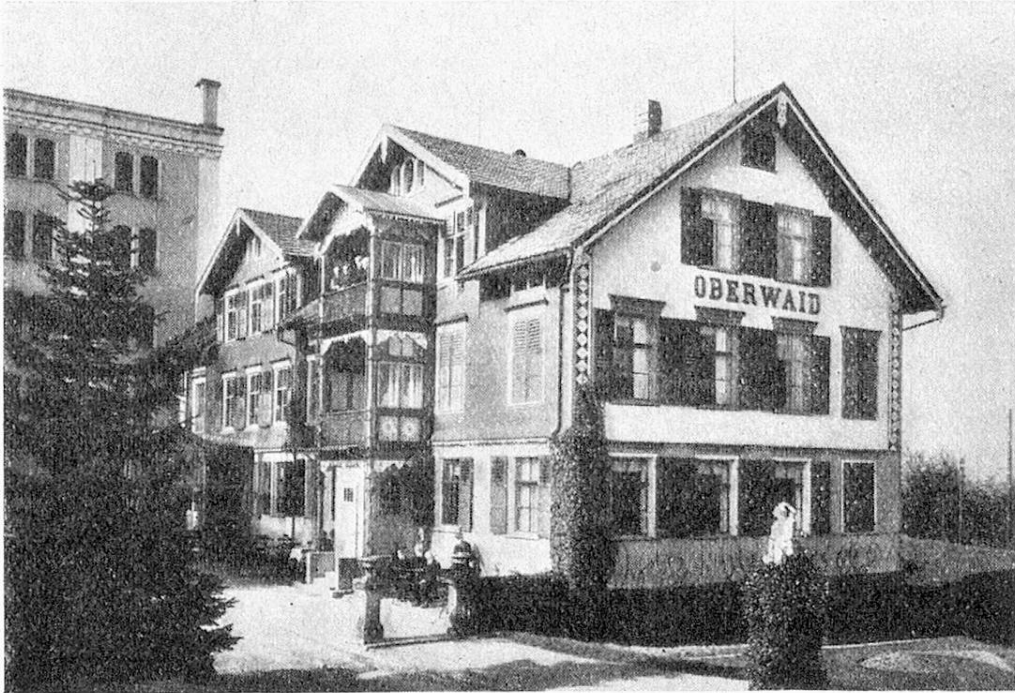
Schweiz. Altersheim Kurhaus Oberwaid bei St. Gallen.

gen vorzulesen. Gesang- und Musikvereine lassen es sich nicht nehmen, in den Blinden-Altersheimen mit ihren Darbietungen die dunkle Nacht der Blinden zu erhellen durch Aufleuchtenlassen innerer Sterne. Solche Darbietungen werden weit höher geschätzt als der oben geschilderte Ersatz, doch wird auch dieser gerne entgegengenommen in Ermangelung von etwas besserem.