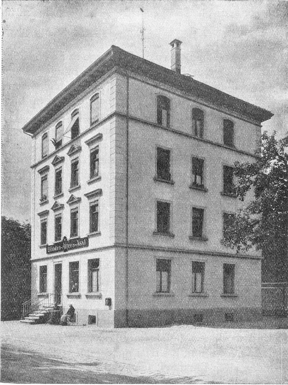
Ostschweiz. Altersasyl für Blinde in Heiligkreuz-St. Gallen.

In neuester Zeit sind der Genfer- und der Tessiner-Blindenfürsorgeverein bestrebt, die Gründung von Blinden-Altersheimen in die Wege zu leiten.