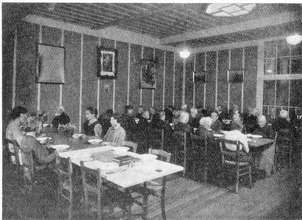
Blinde Frauen des Altersheims Oberwaid beim Essen. Femmes aveugles de l'asile des vieillards Oberwaid à table.

Manche alte Blinde sind in den bestehenden Blindenheimen aufgenommen oder sind darin alt geworden. In der Schweiz befinden sich folgende Blindenheime, die ältere Blinde beherbergen oder beherbergten.