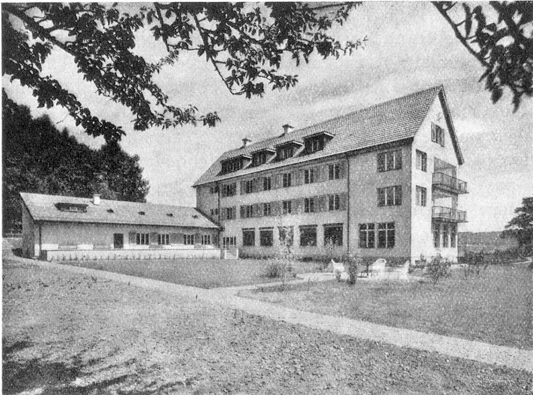
Emilienheim für alte Blinde in Kilchberg b. Zürich: Gesamtansicht. Foyer pour vieillards aveugles à Kilchberg p. Zurich: vue générale.

Un certain nombre de vieillards aveugles sont hospitalisés actuellement dans des asiles pour voyants, mais les conditions de leur vie seraient meilleures dans une maison qui leur serait destinée. Le contact journalier de leurs compagnons d'infortune, mieux à même que quiconque de comprendre leur mentalité leur est moralement plus utile que celui des voyants, même animés des intentions les meilleurs. Du reste, la plupart des asiles pour voyants admettent difficilement les aveugles.