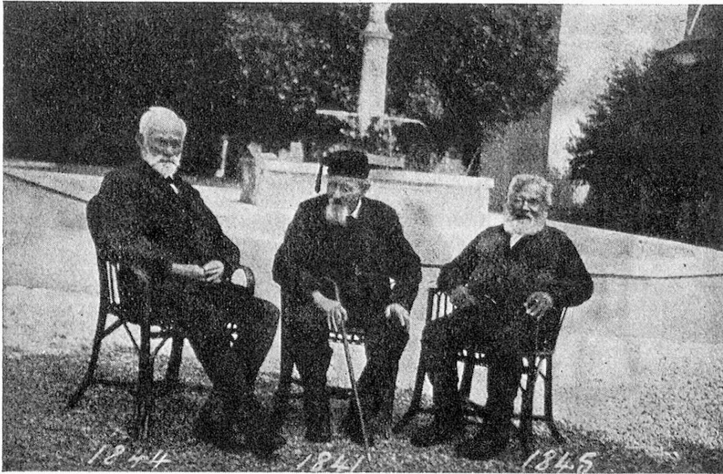
Drei Veteranen in Gais.

ser wurde der Stiftung bereits im Frühjahr 1919 zur Unterstützung angemeldet. Neben ihm werden noch 4 weitere Neunzigjährige von der Stiftung seit mehr als 10 Jahren betreut, ein Beweis, wie viel Gutes diese schon stiften konnte, aber auch wie lange Altersunterstützung und Altersversicherung in Anspruch genommen werden können. Die Angabe von Widmer, daß unter seinen 97 Hochbetagten keine Kranken und Invaliden, vor allem keine Blinden, Tauben, Gelähmten und Bettlägerigen sich befinden, kann ich nicht vollkommen bestätigen. Einzelne unserer Neunzigjährigen sind blind, taub oder teilweise gelähmt. Allerdings von der Mehrzahl werden keine besonderen Krankheiten gemeldet, was der Auffassung recht gibt, daß Altern und Krankheit nicht identisch sind. Wenn wir dagegen die Insassen unserer Altersheime daraufhin untersuchen würden, bin ich fest überzeugt, daß sich noch mehr durch Krankheit Invalide unter den Hochbetagten finden würden. Widmers Alte stammen ausschließlich aus der Landwirtschaft, stellen somit eine besondere Berufsklasse dar, aus deren Verhältnissen man nicht Schlüsse auf die Gesamtheit der Neunzigjährigen ziehen darf. Vielleicht