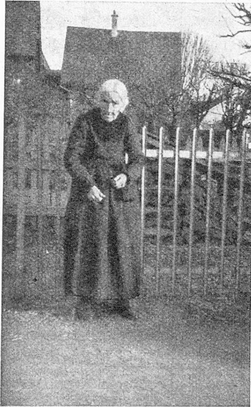
Alte Frau aus Appenzell I.-Rh.

über der öffentlichen Armenpflege, der bis dahin zu einem erheblichen Teil die Altershilfe überlassen war, ist ein doppelter. Einerseits sind Voraussetzung, Art und Maß der Leistungen stärker der sozialen Schichtlage angepaßt; andererseits sind es nicht Fürsorgeleistungen, die von der Bedürftigkeit abhängen, sondern Versicherungsleistungen, die beim Eintritt des Versicherungsfalles — Alter oder Erwerbsunfähigkeit — fällig werden. Für den Versicher-