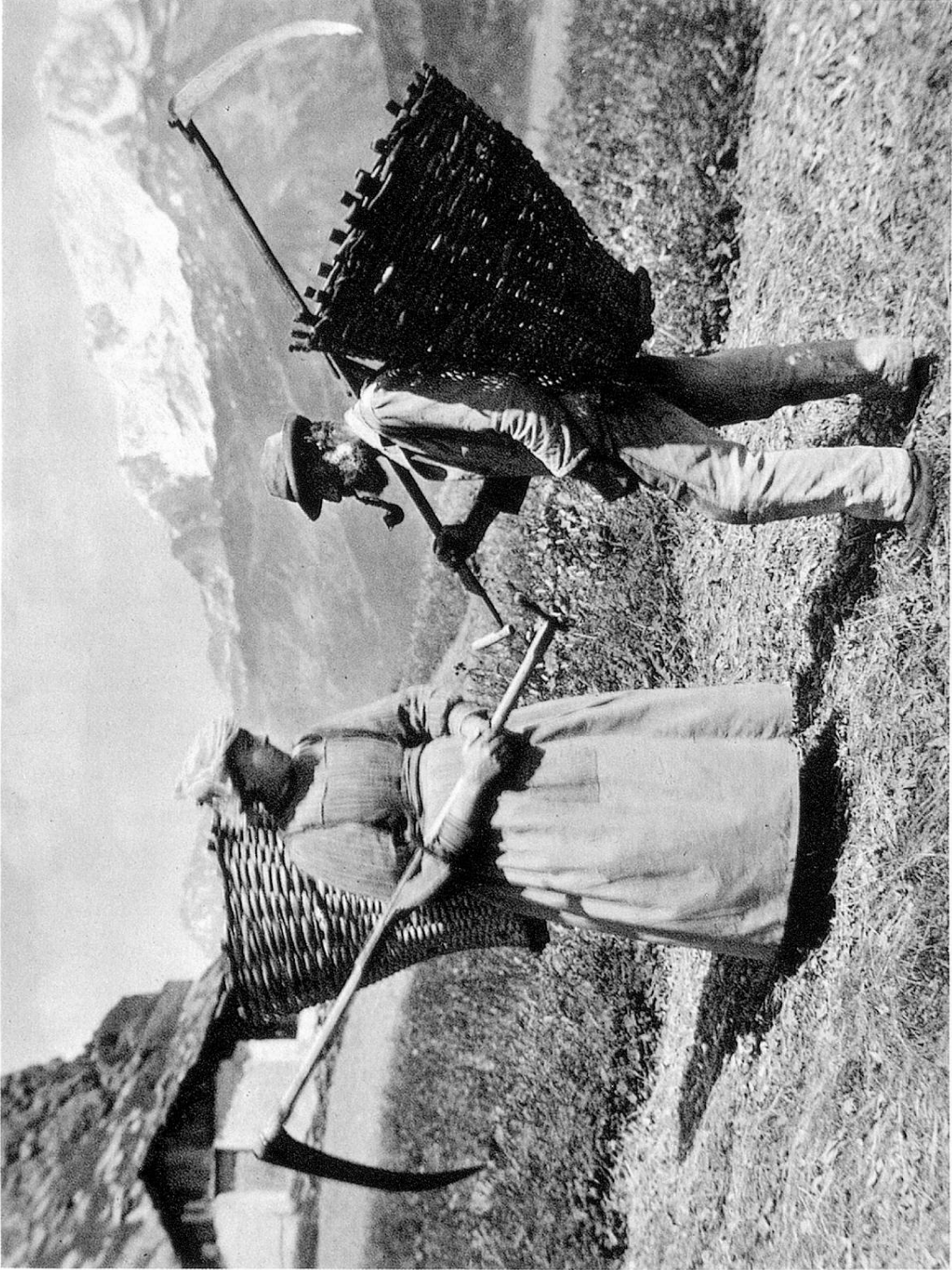
Tiefdruck Brunner und Cie. A.G. Zürich