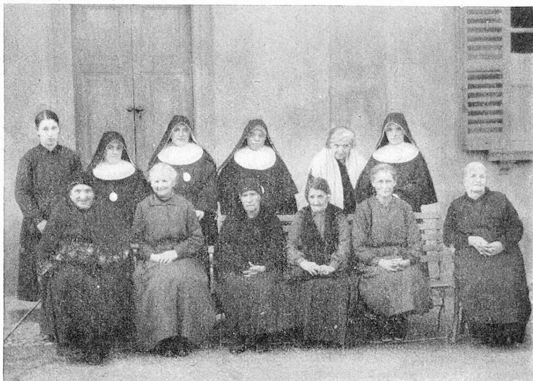
Vecchie donne ricoverate e suore del Ricovero S. Rocco.

Intanto la suora era andata anche a Roma a trattare coi Superiori dell'Ordine. Roma mandò un delegato ad esaminare la cosa, il quale ne sembrò entusiasta. Tutto dunque sembrava procedere a gonfie vele, quando ad un tratto dall'Italia, dal monastero della suora e da altri monasteri del medesimo Ordine cominciarono ad arrivare ripulse sopra ripulse. La povera suora restò come annientata. Che fare pertanto del denaro raccolto? La suora non esitò un istante. Mise a disposizione del Ricovero erigendo la somma raccolta e ritornò in Italia, a rinchiudersi di bel nuovo tra le mura del suo monastero. Povera suora! come è degna di essere ricordata!