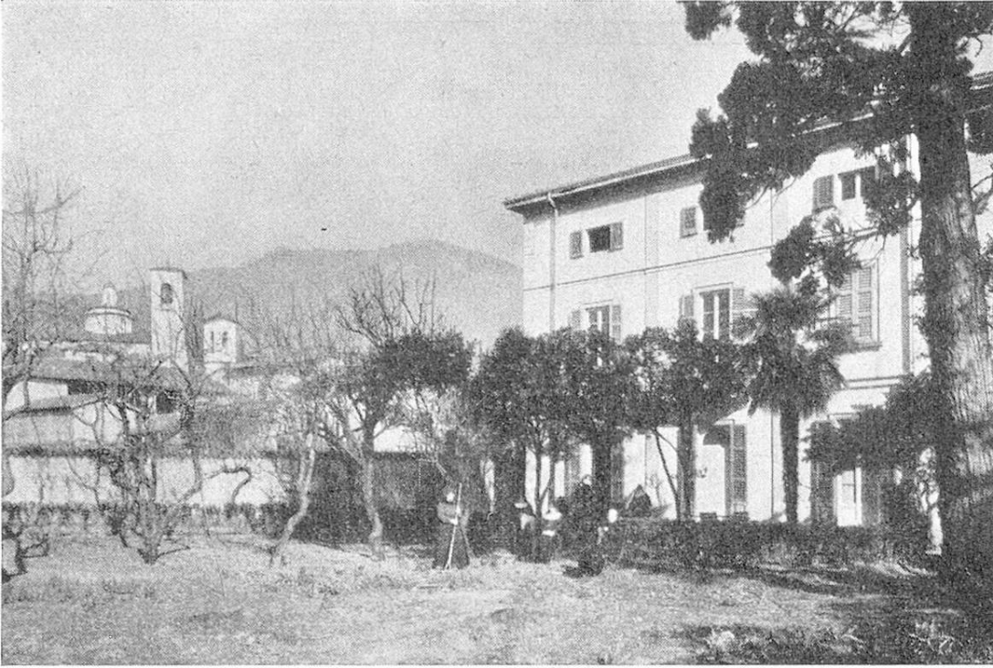
Il Ricovero S. Rocco visto dal giardino.

Nel mese di ottobre dell'anno 1935 si faceva una fondazione: la casa Catenazzi veniva acquistata, e il Ricovero aperto.