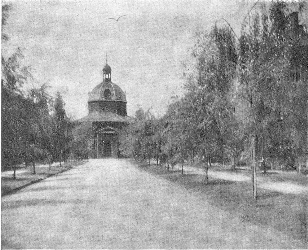
Die Kirche der Altersstadt.

testen Sehenswürdigkeiten der Stadt gezeigt wird. Das Erstellungskapital betrug ca. 6 Millionen dän. Kronen (100 Kr. = 103.60 Schweizerfranken), die Betriebsausgaben belaufen sich nach den zuletzt zugänglichen Statistiken auf etwa 2,5 Mill. Kr., die Ausgabe pro Verpflegungstag auf etwa 4.50 Kr.