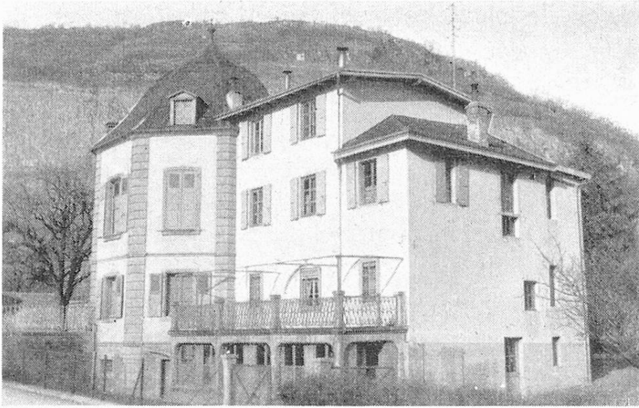
La Gloriette, asile pour femmes à St-Maurice.

Quand à Madame X, 93 ans, elle n'est pas pressée de quitter ce monde.