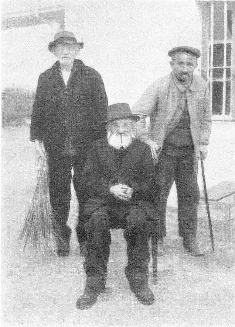
Le groupe des trois.

La plupart sont descendus dans la cour. Ils attendent, un peu émus, confortablement assis sur leurs bancs de chaque côté de l'entrée. C'est comme qui dirait une revue qui se prépare.