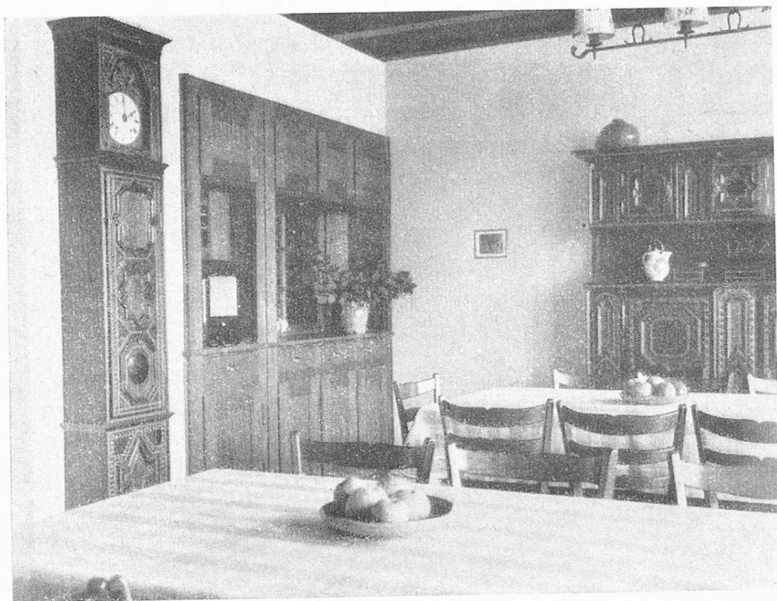
Das Eßzimmer des Altersheims Laupen.

gegenseitige Aushilfe mit Personal und Räumlichkeiten möglich. Das gemeinsame Wirtschaftsgebäude bildet den Mittelbau: er enthält unter der Erde die Heizungsanlage, im Parterre den Haupteingang, ein kleines Büro für den Empfang, die Küche und zwei Zimmer für das Küchenpersonal und die Altersheimschwester.