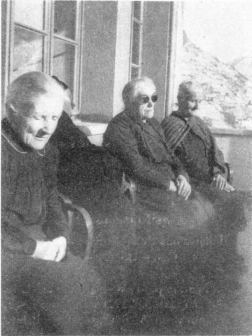
Privées de la vue, les aveugles âgées jouissent du soleil

entre Confédération et cantons. Mais si l'on rejette cet impôt, il faut trouver autre chose.