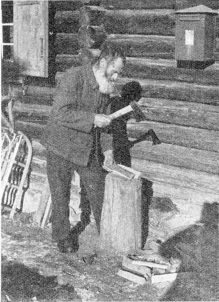
Holzspalten, der Zeitvertreib des alten Bergbauern