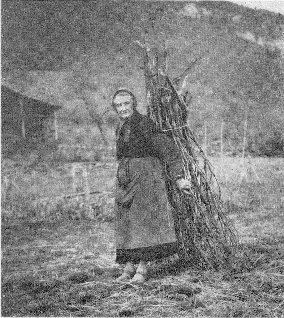
Neuchâteloise, âgée de 92 ans, rentrant avec un fagot de bois

mettre un balcon de bois pour que je puisse aller m'y reposer . . . quand . . . je serai . . . vieille!"