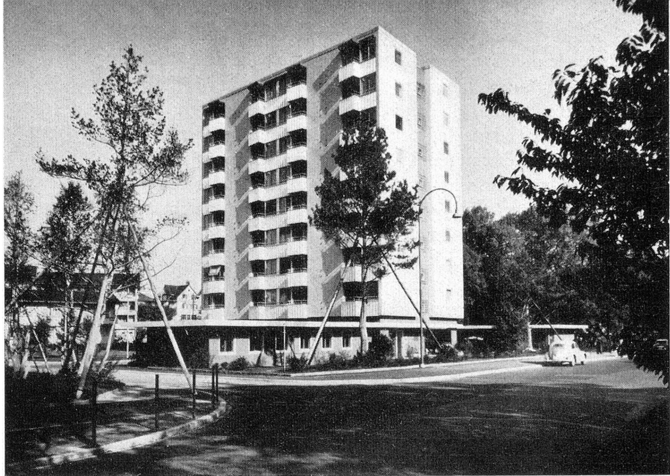
Hochhaus der Siedlung Felsenrain in Zürich

Die 39 Einzimmer- und 6 Zweizimmerwohnungen waren nebst 1 Zweieinhalbzimmerwohnung am 1. August 1959 bezugsbereit. Die Grundfläche der Zimmer beträgt 16,6 \text{ m}^2 , die zweiten Zimmer sind etwas kleiner. Jede Wohnung verfügt über eine Küche und ein Kellerabteil, die Zweizimmerwohnungen haben zusätzlich ein eigenes Bad. Das warme Wasser liefert ein Grossboiler: Badeanlagen für die Mieter der Einzimmerwohnungen und 1 Waschküche stehen zur gemeinsamen Benützung offen.