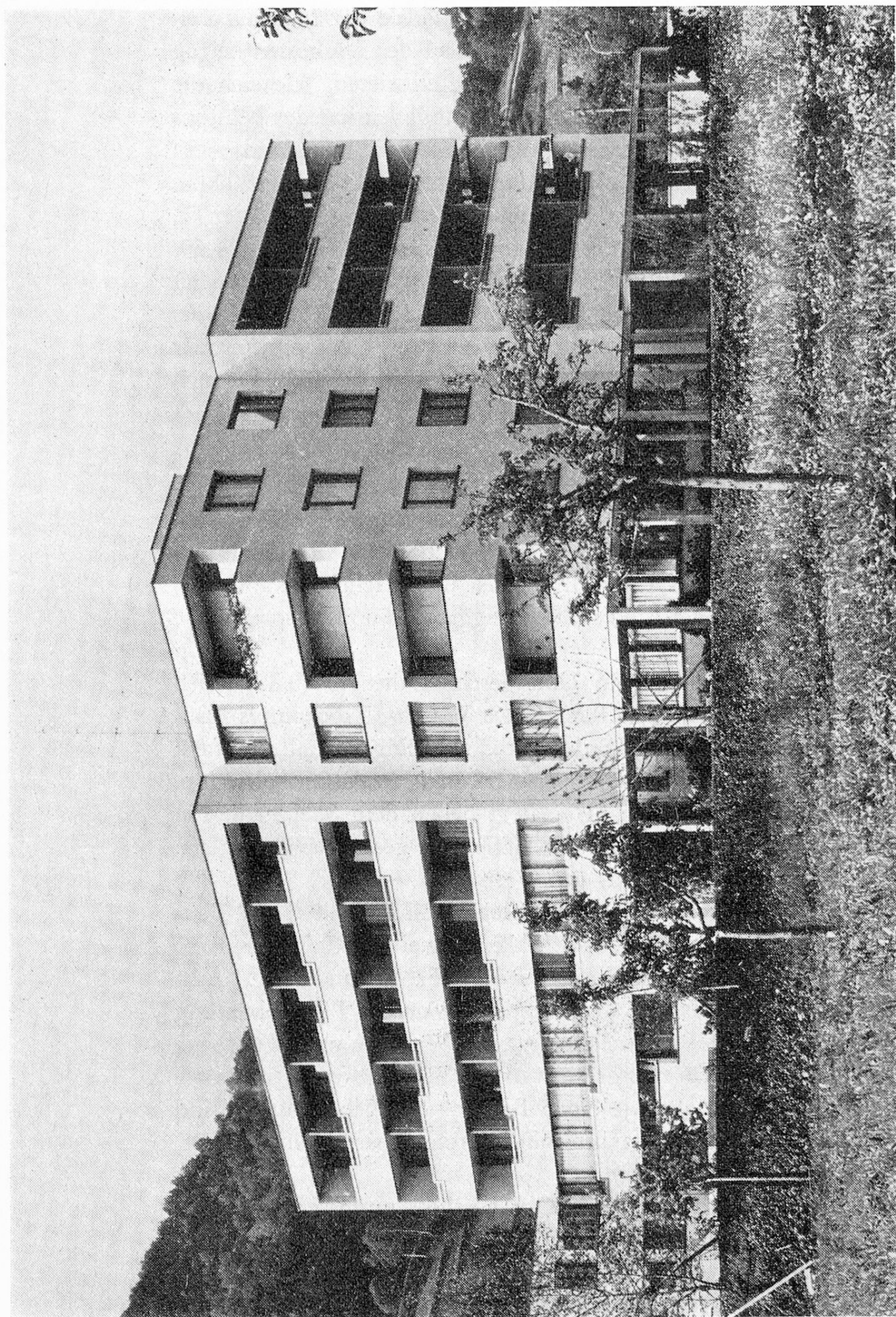
«Hof Haslach», Au/SG