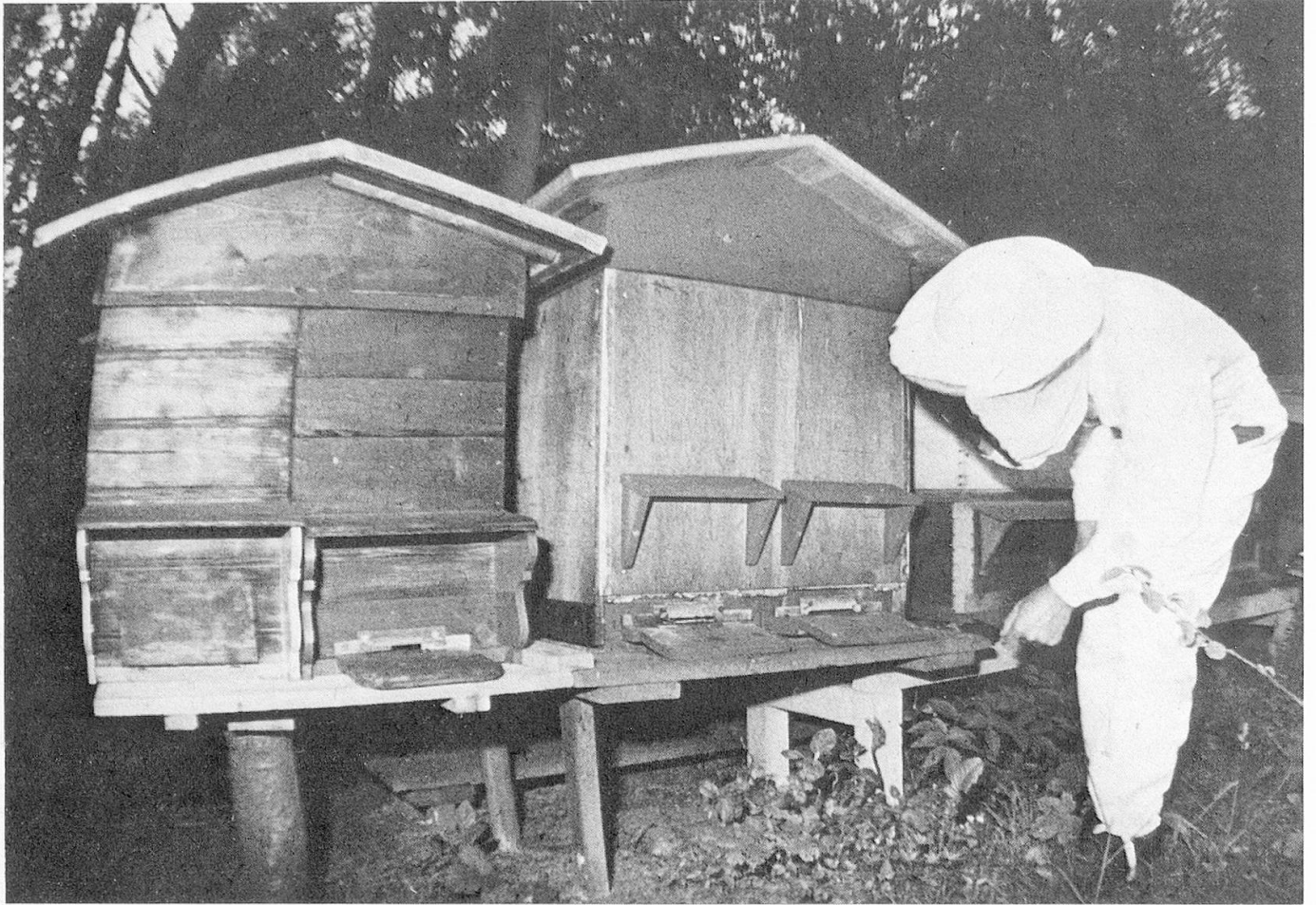
4 Imker Diserens im «Tarnanzug» vor seinen Bienenkästen auf gefahrvoller Mission. Es gilt abzuklären, ob die Bienen nur Nahrung für die junge Brut oder Honig heimbringen.

belstücke. Was lag näher, als unsere BBC-Monteur um ausgediente Transportkisten zu bitten und die einfachen Gebrauchsmöbel selber zu zimmern.