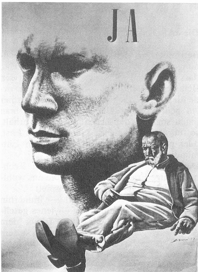
Werbeplakat für die AHV - Volksabstimmung 1947 von Hans Erni

können diese durch Ergänzungsleistungen, kantonale Beihilfen und Gemeindezuschüsse meist behoben werden. Noch viele Betagte schrecken in einer falschen Scham vor solchen Rechtsansprüchen zurück. Die ordentlichen Ausschüttungen werden in diesem Jahr 6,5 Milliarden Franken übersteigen, ab 1975 werden es 8,4 Milliarden sein — im Gründungsjahr 1948 waren es erst 127 Millionen. Diese Entwicklung — sie entspricht einer Verzehnfachung der Minimalrenten innert 25 Jahren — war nur möglich dank einer leistungsfähigen Wirtschaft und einer ungebrochenen Hochkonjunktur, in der auch das Erwerbseinkommen von 10 auf 72 Millionen emporschnellte.