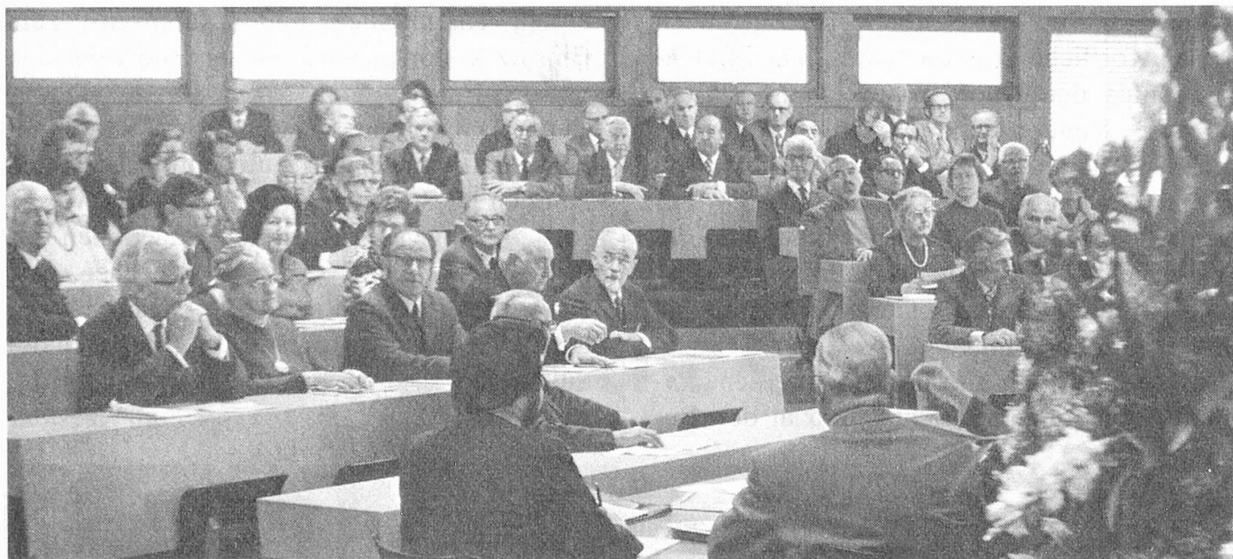
Blick in die Aula

Nidwaldens Landammann Vokinger begrüßte in der blumengeschmückten Aula des Berufsschulhauses von Stans die Abgeordneten der Stiftung Für das Alter / Pro Senectute, die sich am 29. Oktober 1973 aus der ganzen Schweiz eingefunden hatten.