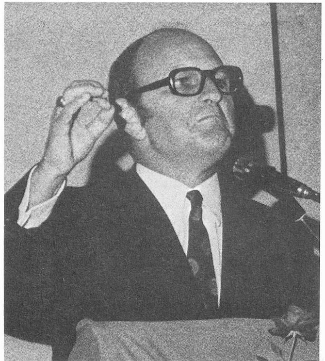
Nationalrat Dr. Paul Bürgi, FDP, St. Gallen, war Präsident der nationalrätlichen Kommission für die 8. AHV-Revision im Jahre 1972. Wir zitieren im Folgenden einige Abschnitte aus seiner Ansprache an die 1800 Teilnehmer der «Altersbegegnung» Frauenfeld am 20. Juni 1973.