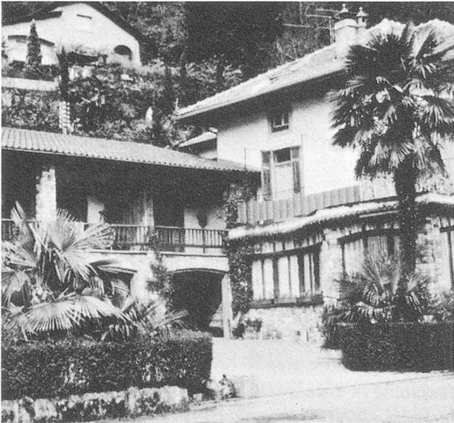
Die «Casa Lucerna» in Caslano, Heimstätte der Luzerner Ferienkolonien für Betagte.

Frühjahr 1974 bereits vier vollbelegte zweiwöchige Kolonien in der «Casa Lucerna»