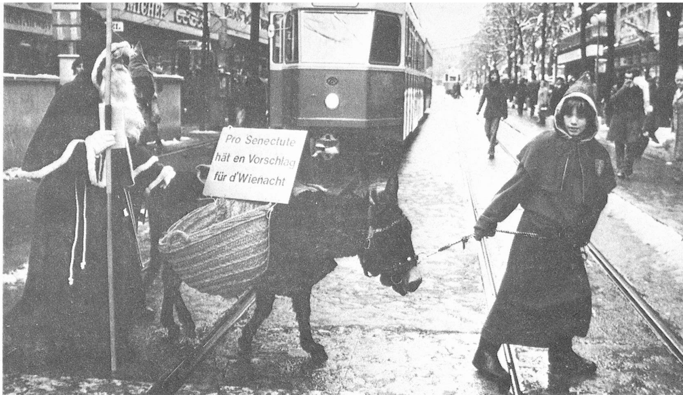
Esel auf der Bahnhofstrasse