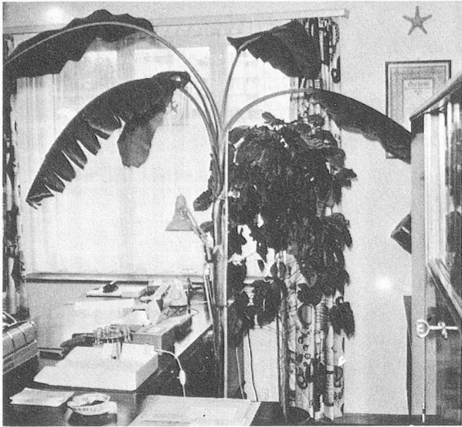
Bananenbaum vor dem Ansetzen der Blüte.

Es sind etwa drei Jahre her, als ich nach einem Besuch in Kenya eine kleine, vielleicht 30 cm hohe Pflanze in einem auf der einen Seite geschlossenen Kartonrohr mit nach Hause brachte. Beim Zoll musste die Pflanze gezeigt und dann zur Desinfektion in eine Gaskammer gebracht werden, damit allfällige Schädlinge und Krankheitskeime vernichtet werden könnten.