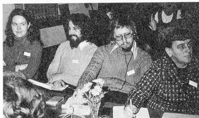
Aufmerksame Zuhörer in Gwatt

Pro Senectute/Für das Alter führte Ende November im reformierten Tagungszentrum Gwatt bei Thun eine weitere zweitägige Mitarbeitertagung unter dem Vorsitz des Zentralsekretärs, Dr. U. Braun, durch. Seit 1971 werden die Mitarbeiter aus den 70 Beratungsstellen in der ganzen Schweiz regelmässig fachlich weitergebildet. Der erste Tag war der internen Information gewidmet: der 2. Etappe der 8. AHV-Revision, den neuen Regelungen in der Hilfsmittelfinanzierung, den Ergebnissen und Folgerungen aus einer Image-Umfrage, der letzten Oktobersammlung und der Präsentation der Stiftung an der Muba 1975. Am zweiten Tag behandelten Dr. Fisseni, Bonn und Prof. Hugonot, Grenoble, als Psychologe und Mediziner das