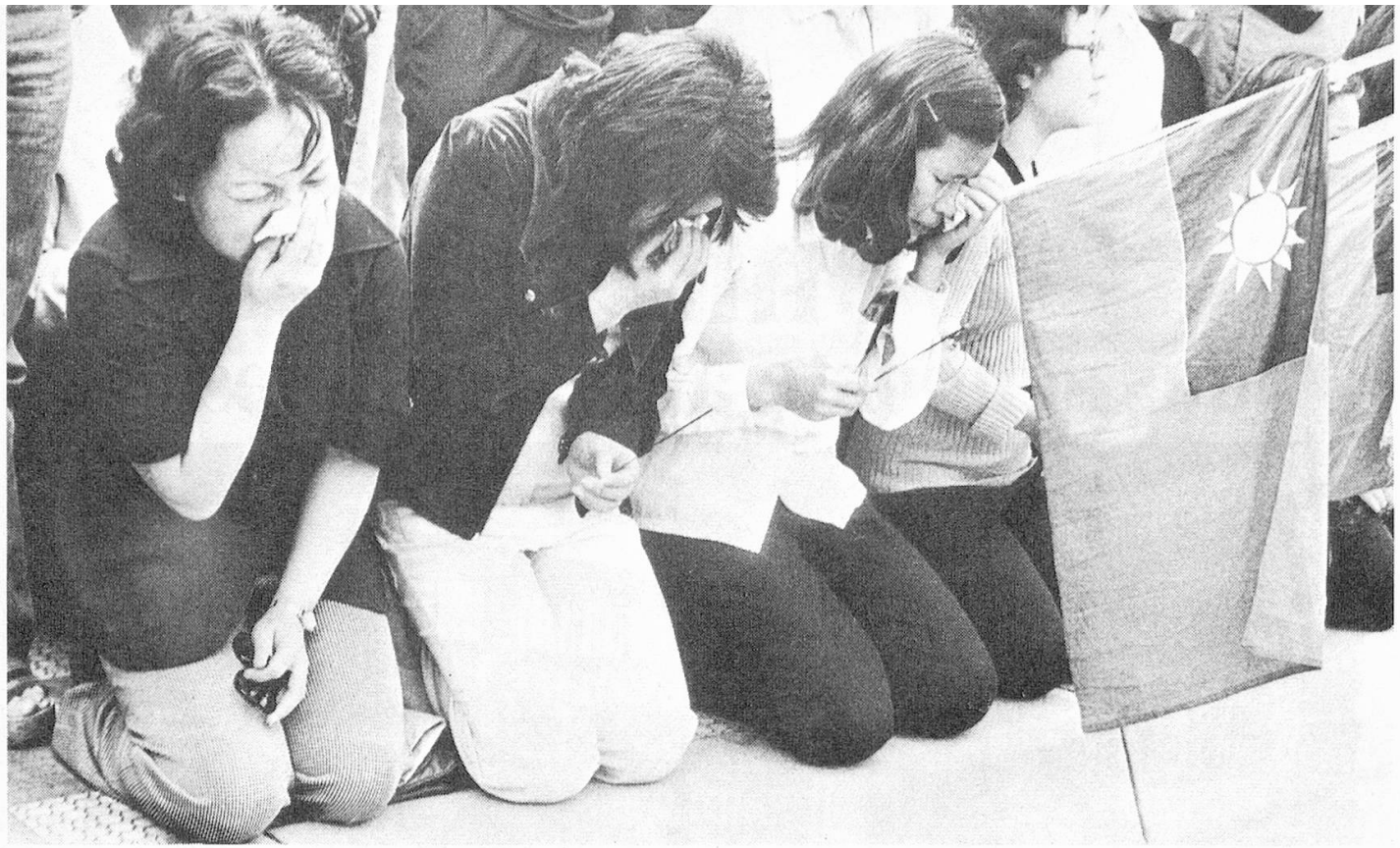
Bittere Tränen auch bei den Jungen während den Beisetzungsfeierlichkeiten von Tschiang Kai-schek

in der Militärakademie. Auch nach der Uebersiedlung nach Taiwan zog er eine kleine Wohnung mit guter Aussicht einer Villa vor.