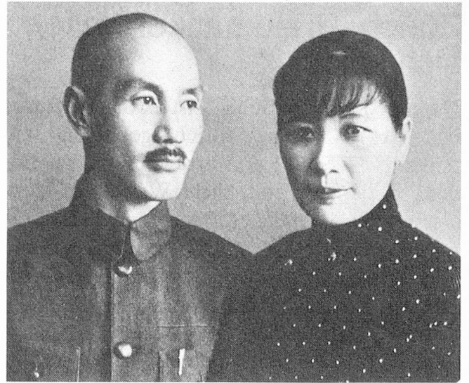
Der Marschall und seine Gattin in jüngeren Jahren

«Weil ich Müssiggang immer vermeide und mich der harten Wirklichkeit stelle, konnte ich die Schwierigkeiten meines Lebens meistern», sagte Tschiang Kai-Schek einmal. Historiker und ihm Nahestehende wiesen