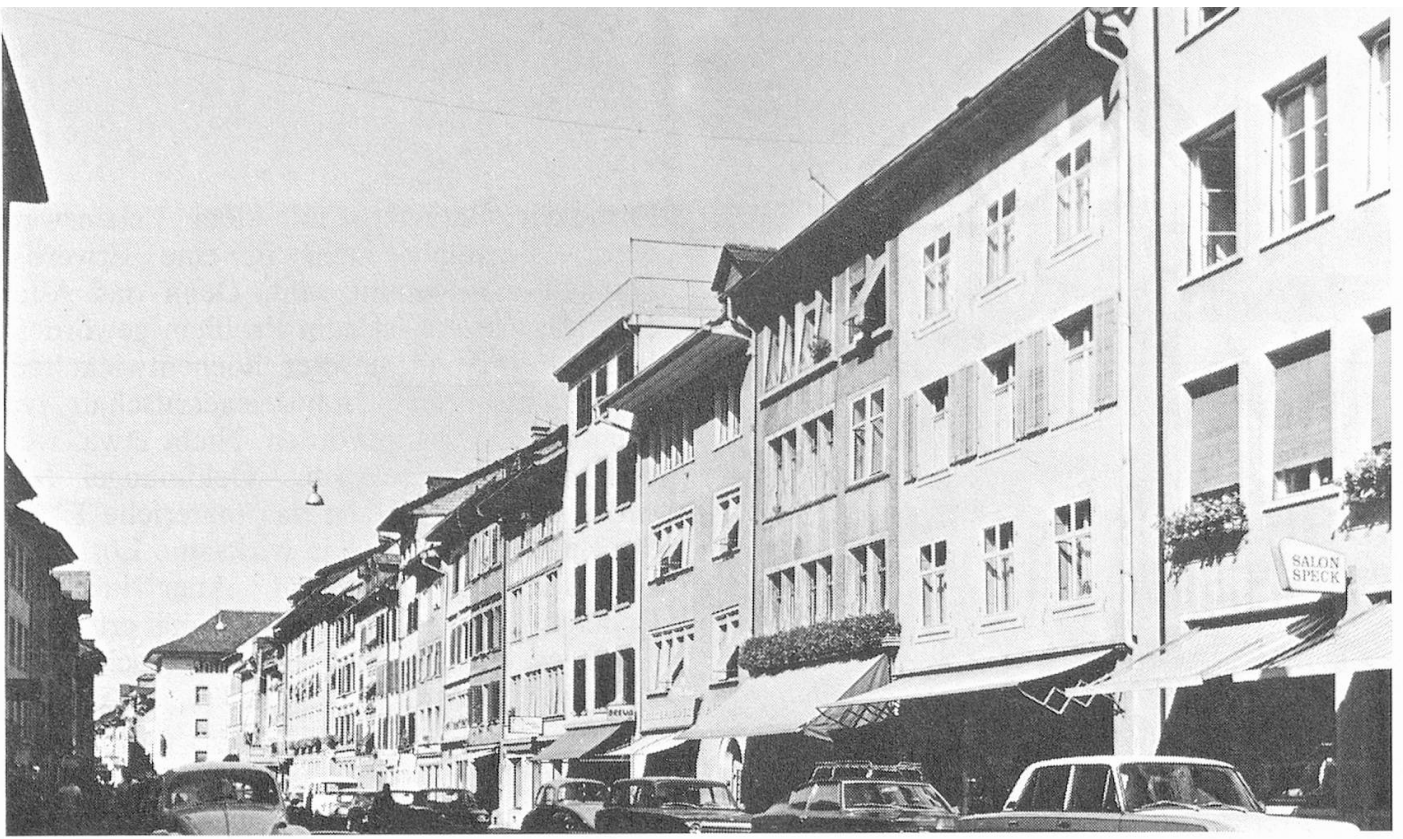
Die Häuserfassaden am Obertor stehen unter Heimatschutz und dürfen deshalb nicht verändert werden.

ausgearbeitet, überprüft und konzentriert. Was herauskam und auch angestrebt wurde, sind nicht einfach papierene Antworten in Form von Sätzen, die mit «man sollte» beginnen. Es sind Modelle, die funktionieren, die eine Verwirklichung anschaulich machen sollen und selber schon ein Stück Wirklichkeit sind. Mit festem Platz in Zeit und Raum. Zugleich aber auch Vorlage für etwas, das anderswo und zu einem andern Zeitpunkt Wirklichkeit annehmen kann. Man hat deshalb auch schon das Wort von den «Modellen im Massstab eins zu eins» geprägt. In dem Mass, in welchem die Modelle Realität annehmen, haben sie ihren Platz in Winterthur. Und zwar aus drei leicht verständlichen Gründen. Urheber des ganzen Unternehmens sind die Winterthur-Versicherungen. Das Feld der Möglichkeiten und Mittel, um das Unternehmen zu fördern, war und ist für die «Winterthur» in Winterthur am grössten. Und schliesslich ist Winterthur, als Stadt mittlerer Grösse mit Industrie, Handel und höheren Schulen, durchaus geeignet, als Beispielfall zu dienen. Denn das Problem des Alters ist überall akut, vornehmlich aber in städtischen Verhältnissen.