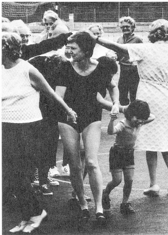
Unter vielen Betagten macht plötzlich auch eine Mutter mit ihrem Kind mit.

Abschliessend möchte ich den Brief der Leserin Frau G. P. auszugsweise bringen, sie erzählt, wie sie zu ihrem Leidwesen den Al-