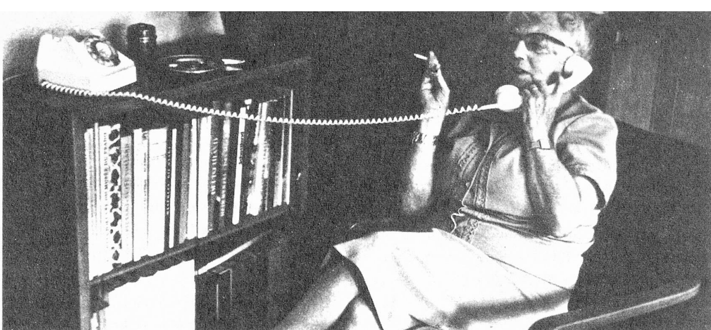
Ein langes Gespräch am langen Draht. Das Telefon ist ein unentbehrliches Bindeglied zur Aussenwelt für viele Rentner und Invalide.

schränkten Ortsgespräch. Wiederum dürften jene, die auf das Telefon als Kontaktmittel besonders angewiesen sind, also Betagte, Gebrechliche und Behinderte (und unsere «Telefonketten»!) besonders schwer betroffen werden. Wäre es nicht möglich, die Orts- taxe z. B. fest von 10 auf 20 Rp. zu erhöhen? Hat man nicht in der Bundesrepublik Deutschland aus sozialen Gründen auf eine «ZIZO-Lösung» verzichtet?