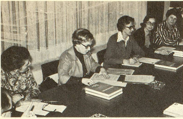
Blick in die sympathische Runde der Leiterinnen der aargauischen Beratungsstellen.