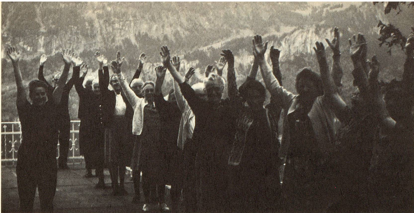
«Morge früh wenn d'Sunne lacht . . .» Frühturnen einer Feriengruppe auf dem Hasliberg.

feehock oder ein Unterhaltungsprogramm folgen. Wie die rasch steigenden Teilnehmerzahlen zeigen — es gibt heute etwa 25 Clubs mit rund 700 Teilnehmern — entspricht diese Kontaktgelegenheit einem echten Bedürfnis. Diese Clubs arbeiten praktisch selbsttragend. Wenn wir schon vom Essen reden, seien die Kochkurse für Senioren nicht vergessen; es nahmen 86 Männer daran teil. Das Bedürfnis der Herren, notfalls selber kochen zu können, spricht für den Wandel der Auffassungen; vor 20 Jahren hätte wohl kaum ein Interesse bestanden.