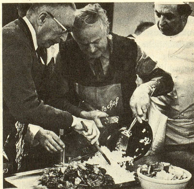
Kochkurs für Senioren — eine gluschtige Sache.

RC: Aber ja. Da wären die Altersclubs zu nennen. In 13 Ortschaften treffen sich die Betagten ein- bis viermal monatlich. Besonders erfolgreich und bekannt ist das Beispiel von Baden, wo sich jeweils rund 150 Besucher im Jugendhaus einfinden. Hier haben wir durchschnittlich total 580 Teilnehmer. Ebenfalls ein- bis viermal monatlich treffen sich die Senioren in Mittagsclubs . Hier nehmen sie ein preisgünstiges Mittagessen gemeinsam ein und lassen diesem oft einen Kaf-