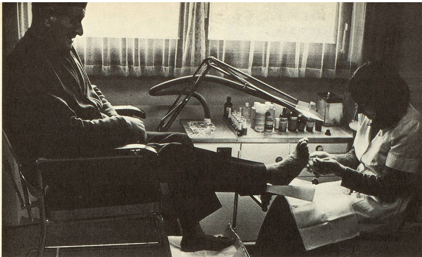
Auf gepflegten Füßen geht es sich besser — besonders wenn sie eine so charmante Spezialistin wie hier in Mettau kuriert.