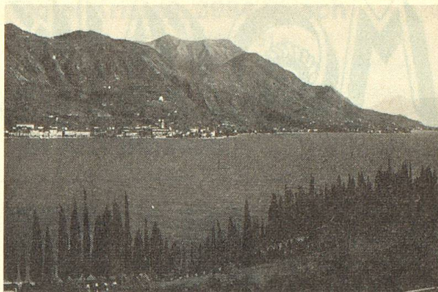
Der zauberhafte Gardasee