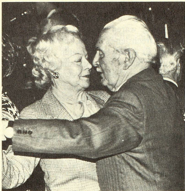
Mit typisch welschem Schwung dreht sich dieses Paar zur nostalgischen Musik.