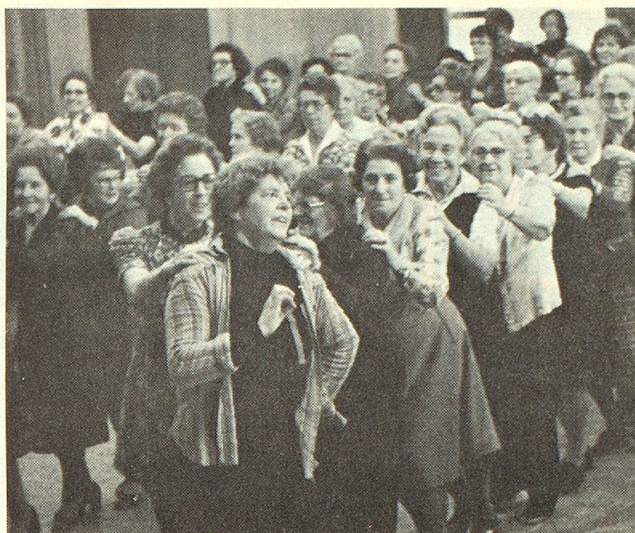
So munter ging es zu am Volkstanztreffen vom Februar 1978.

Voraussetzung war, dass die Tänze in allen Gruppen gleich instruiert worden waren. Die Leiterinnen hatten sich ihr Rüstzeug in den Kursen auf dem Balmberg und im Schloss Hünigen erworben, von denen Ernst Hess berichtet hat. Sie alle sind selbst «angefresene» Tänzerinnen und führten als Einlage einen rassigen «Amerikaner» vor, bei dem die Röcke nur so flogen. Natürlich durfte in