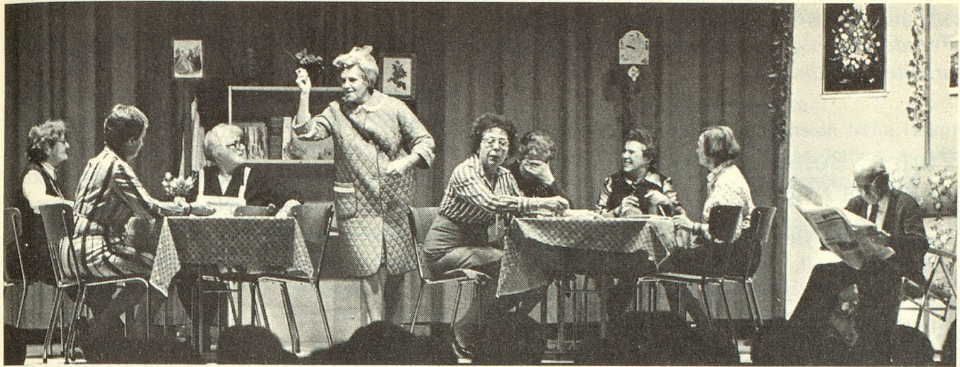
Szenenbild aus dem 1. St.-Galler Senioren-Theaterstück «Mitenand gohts besser». Das Stück von Elsa Bergmann handelt vom Alltag in einem Altersheim. Die 16 Spieler, darunter drei Herren, sind 56- bis 76jährig.

rung» angeeignet haben. Sie geraten nicht mehr so schnell aus dem Konzept, wenn es einmal ein «Blackout» gibt. Einmal sollte Frau Alder erzählen: «Jetzt bin i scho es Jahr do i der Alterssiedlig Sunnehof... Sie kehrt den Satz um und sagt «Jetzt bin i scho es Jahr lang i der Alterssunne Siedligshof!» Ob da nicht mancher Zuschauer glaubte, sie spreche von einer neuen Beiz? Herr Christen sitzt melancholisch am Tisch und erzählt resigniert, wie wenig doch die Alten heute in der Oeffentlichkeit gelten. Plötzlich weiss er den Text nicht mehr und seufzt nur noch: «Mein Gott, o mein Gott, du mini Güeti!», bis er den erlösenden Einsatz der Souffleuse hört.