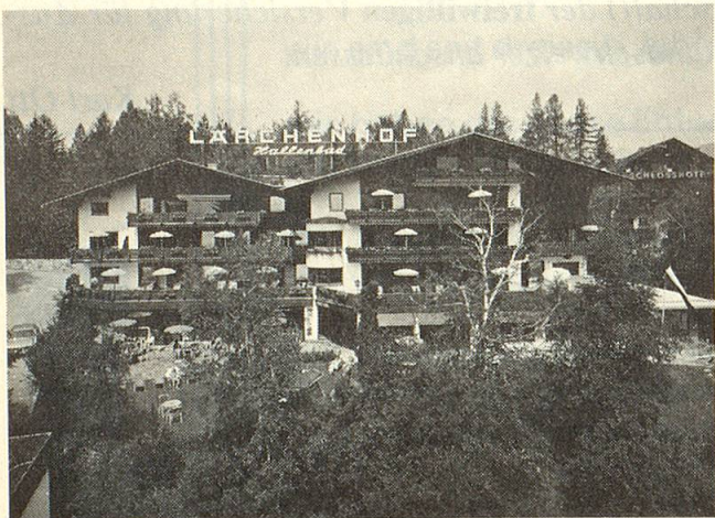
Unser Hotel Restaurant Lärchenhof, Seefeld

Das mit Schönheiten gesegnete Ländle Tirol lädt uns alle ein, eine harmonisch gestaltete, romantische Ferienwoche zu verbringen. Unser Programm, zusammengestellt für unternehmungslustige, gutgelaunte Senioren, bringt Abwechslung, Unterhaltung und beschauliche Stunden ohne Hetze. Dazu haben wir ein ideales, familiär geführtes Hotel der 1. Kategorie in Seefeld ausgewählt, etwas erhöht gelegen, in prächtiger, ruhiger Lage im Grünen. In diesem Hause werden sich alle wohl fühlen, dafür können wir bürgen. Unsere Reiseroute führt durch abwechslungsreiche, reizvolle Gebiete. Als Höhepunkte dieser Reise sind die Schlösser Neuschwanstein und Linderhof, die Krimmler Wasserfälle, das Zillertal und das Oetztal besonders zu erwähnen. Für perfekte Organisation und vorzügliche Reiseleitung garantiert Geri Berz persönlich. Wir freuen uns auf Ihre Anmeldung. GERI BERZ REISEN AG