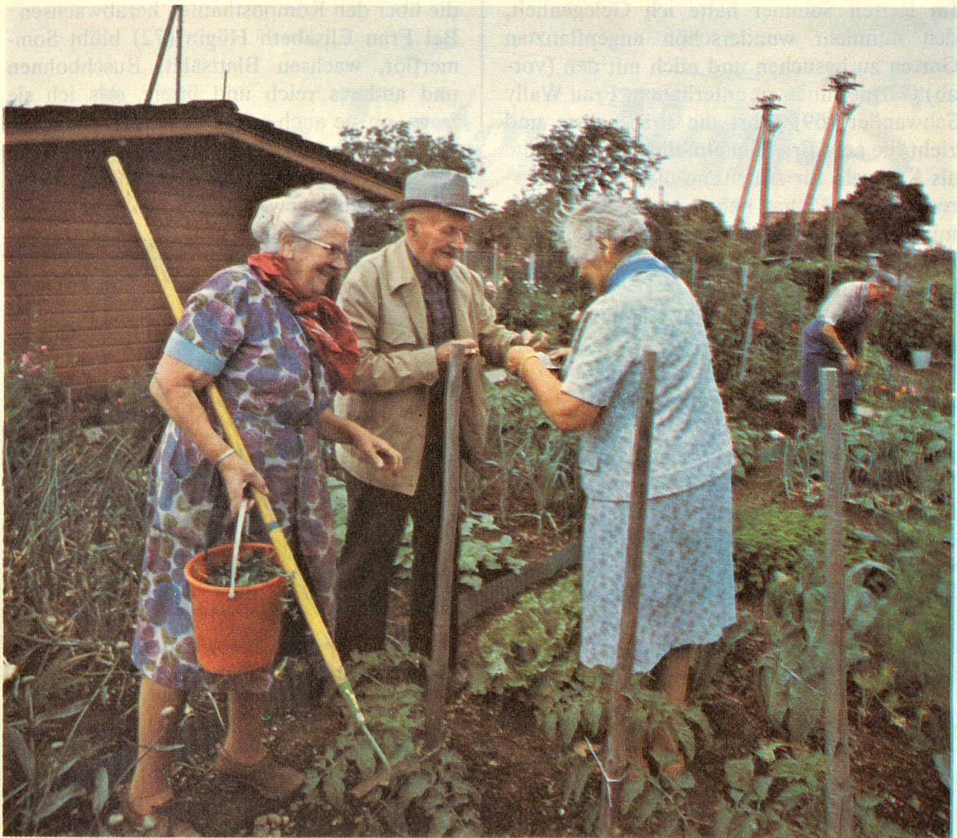
Gegenseitige Ratschläge und ein paar Witze gehören zum Gartenplausch.