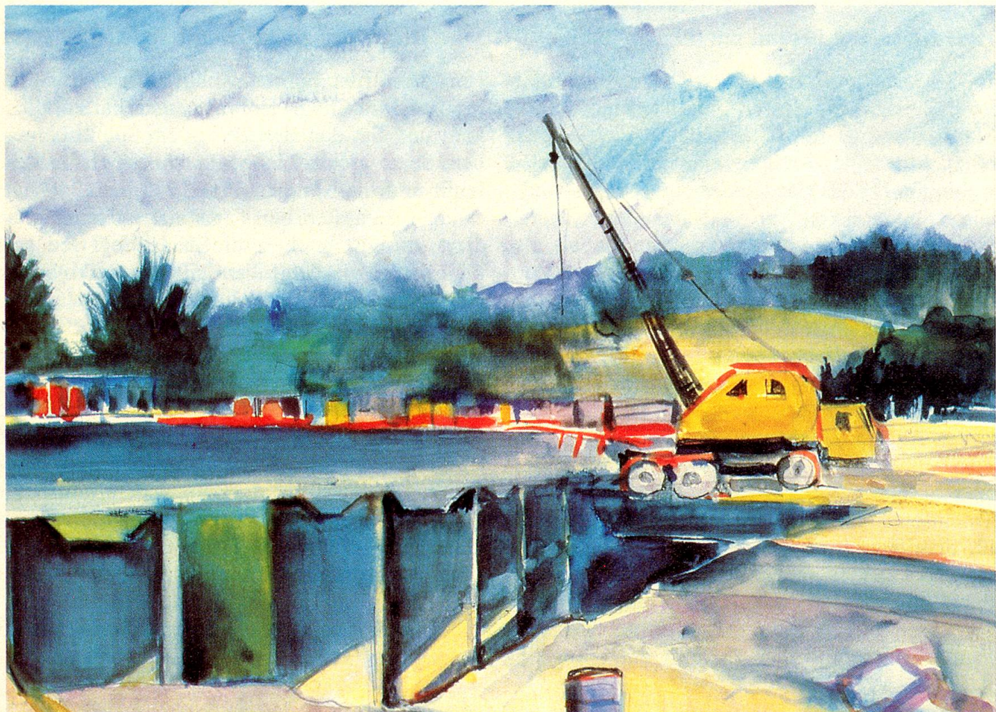
«Goldachbrücke im Bau», Aquarell, 1972, von W. Rüedi