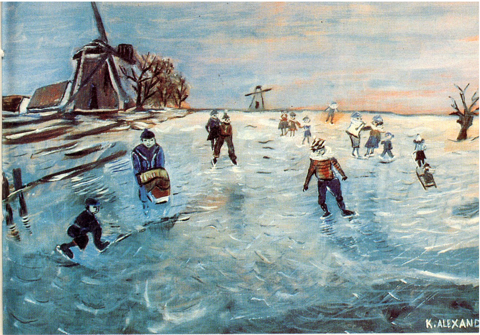
«Eisläufer», Oel, von K. Alexander