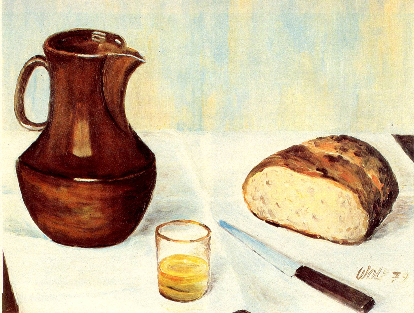
«Stilleben mit Mostkrug und Brot», Oel, 1979, von A. Wolf