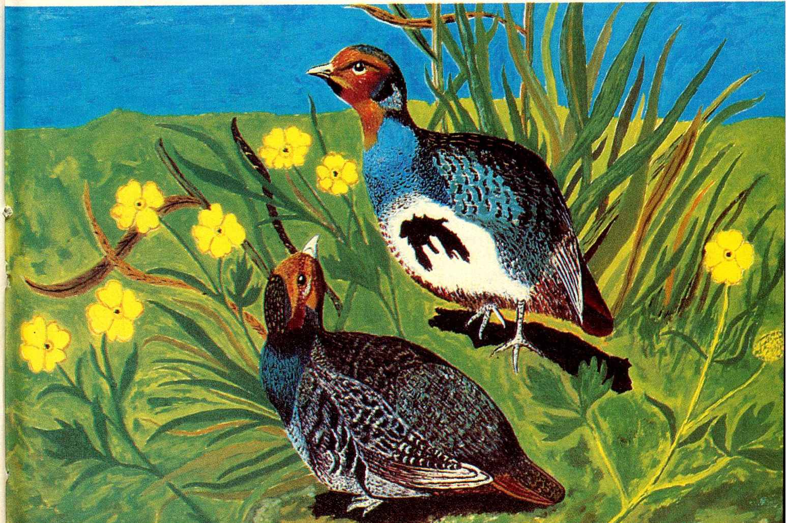
«Rebhühner», Oel auf Holz, von F. Büchel