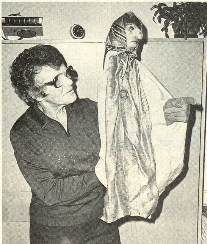
Die Lebendigkeit dieser Stabpuppe wird dadurch erhöht, dass die Hand des Spielers in einem Handschuh mitspielen kann.