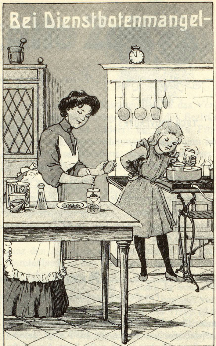
So hat die Firma Sibling für Einmachgläser geworben (um 1910).

1931 Inventur gemacht und dem Arbeitsleben den Rücken gekehrt.