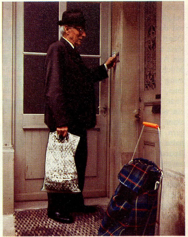
Der frühere Briefträger findet sich in seinem Quartier mühelos zurecht.