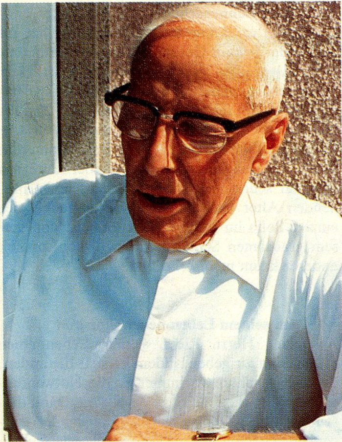
Gerne erzählt der rüstige Senior «Müsterli» aus seinem Leben.