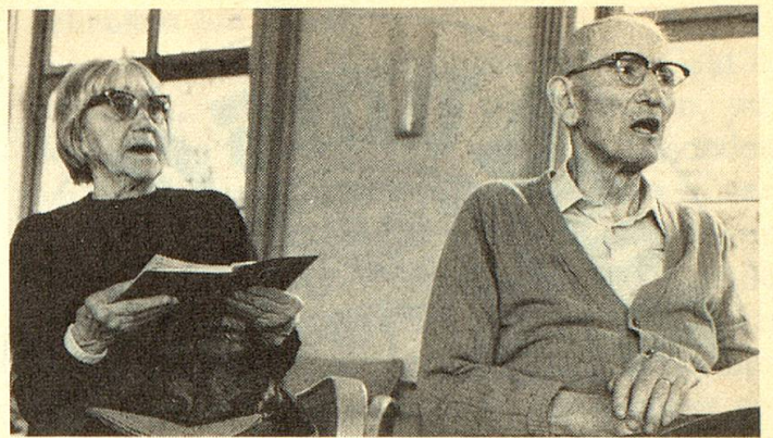
Auch im Pflegeheim bereitet Singen Freude.