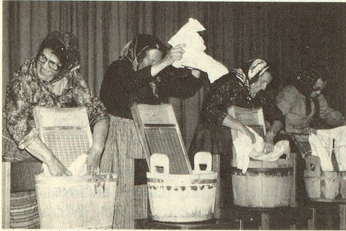
Eine Gruppe wäscht im Takt...