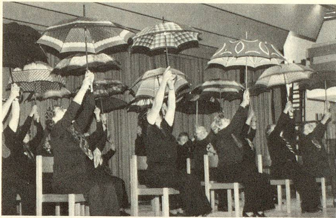
... eine andere produziert sich mit einer Schirm- übung.

Schon mehrmals berichteten wir von Jubiläen von Altersturngruppen. Im Spätherbst war es auch in den Aemtern Signau, Konolfingen und Trachselwald soweit, bestanden doch viele der 64 Gruppen schon seit 10 Jahren. An zwei Nachmittagen füllten je etwa 430 Männer und Frauen das Kirchgemeindehaus in Langnau. Mit Ansprachen, Ländlermusik, Gedichten, Turndemonstrationen, Liedern, Zvieri, Plaudern und Tanzen verging den Emmentaler Seniores der Nachmittag im Flug.