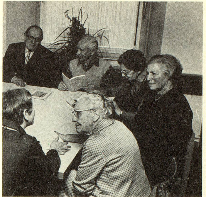
Beim Englischkurs im Treffpunkt lernt man ohne Leistungsdruck.

Bei Redaktionsschluss war das kühne Unternehmen – unseres Wissens eine Pioniertat – noch im Gang. In letzter Minute vernahmen wir, dass alle Teilnehmer das «Happy landing» hinter sich haben und freudestrahlend heimkehrten.