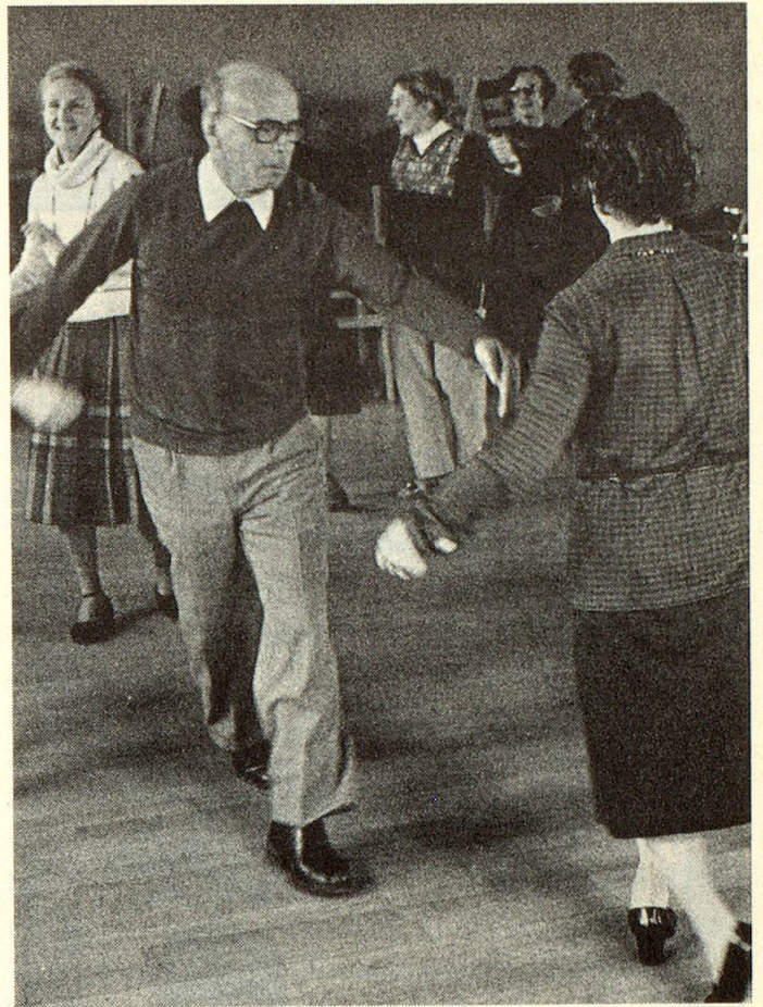
Beim Volkstanz geht es unbeschwert zu.