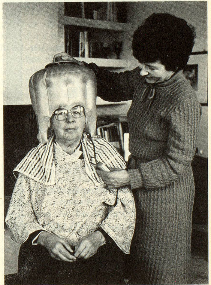
Die Heimcoiffeuse verfügt über eine transportable Trockenhaube.