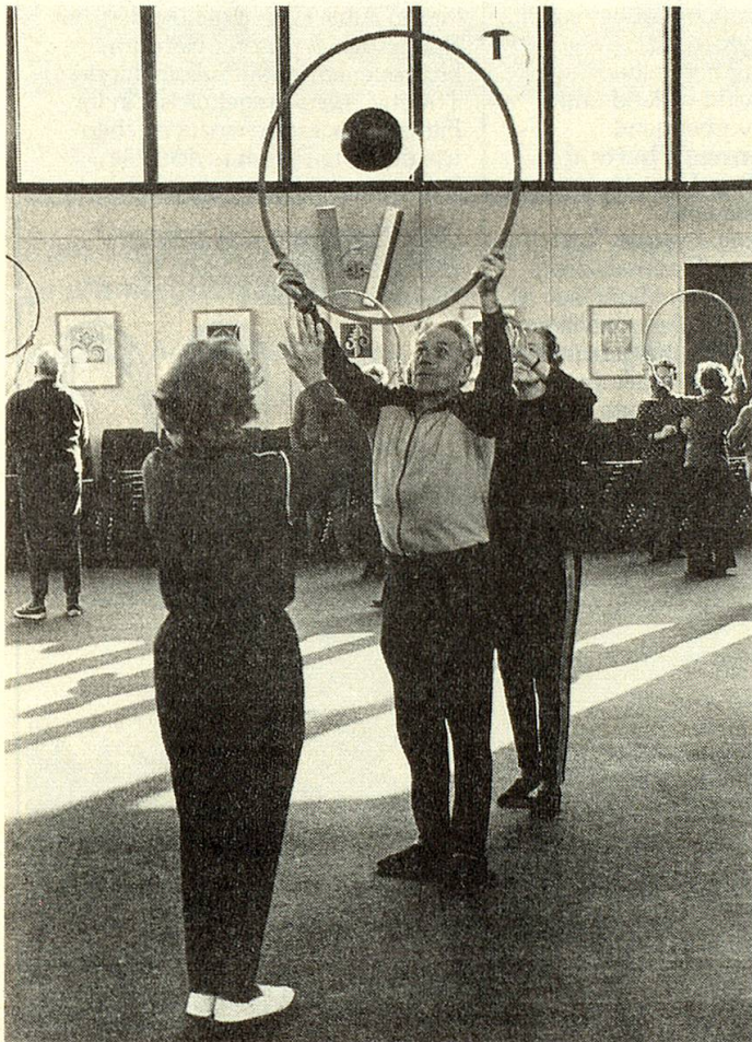
Eine von 50 Altersturngruppen.

Zweifellos wird das gemeinsame Reiseerlebnis viel beitragen zum weiteren Kurserfolg und vielleicht zu ähnlichen Ausflügen ins fremde Sprachgebiet ermutigen.