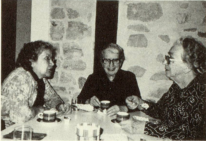
«Kaffeplausch» im Treffpunkt.