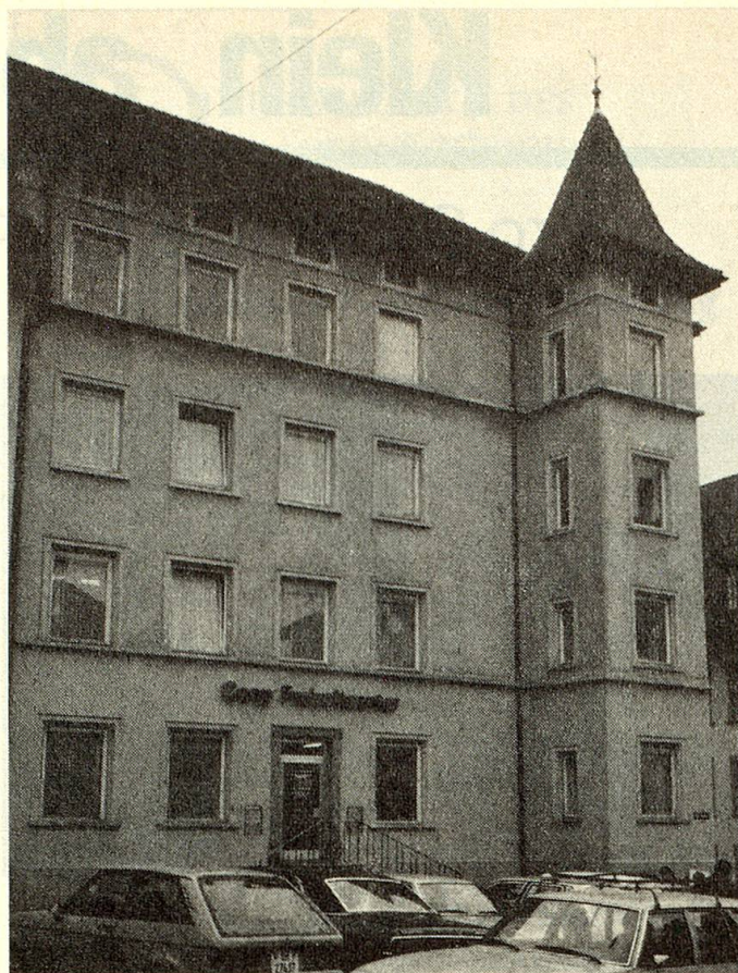
Im Erdgeschoss des «Coop Freizeitcenters» am Herrenacker befinden sich die Räume von Pro Senectute.

Während der Wintermonate alle 14 Tage! Wir laden Referenten ein mit verschiedenen Themen.