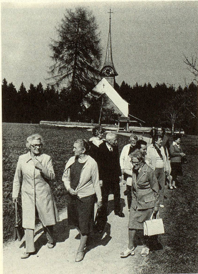
Ausflug bei der jährlichen Ferienwoche, hier in der Nähe von Gwatt bei Thun.