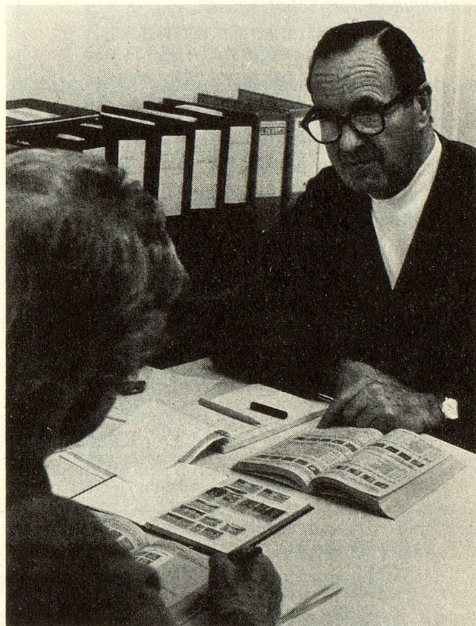
Am Briefmarkentausch-Nachmittag beteiligt sich eine Gruppe «angefressener Märkeler».