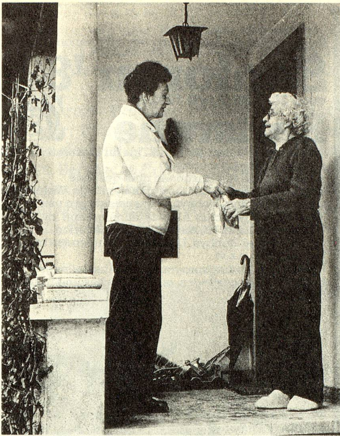
Die Begegnung mit der Mahlzeiten-Verteilerin bietet eine willkommene Kontaktgelegenheit.