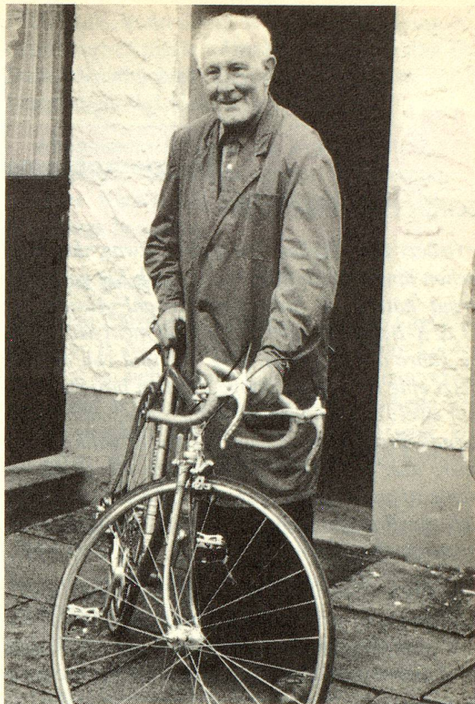
Ein neues Stahlross aus dem eigenen Stall.