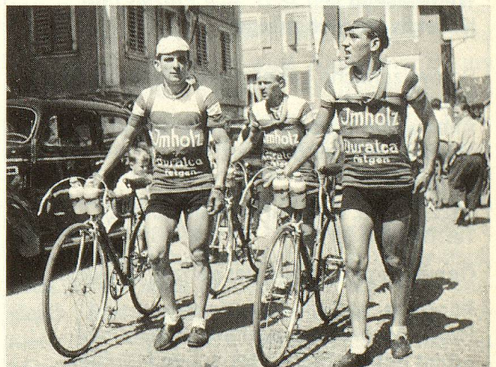
Die «Imholz-Gruppe» an der Tour de Suisse.