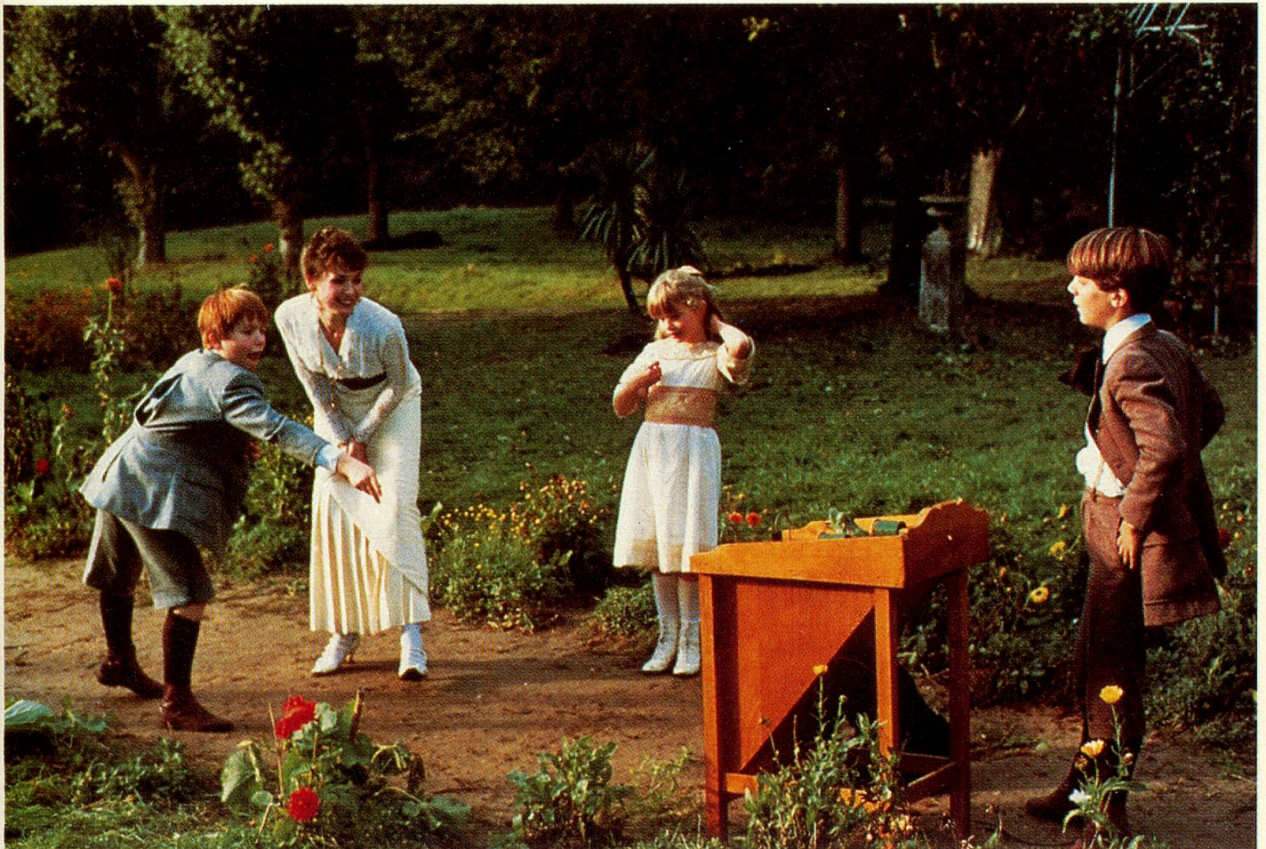
Beglückendes Spiel mit der extravaganten Tante.

Er ist ein Maler seines Gartens, seiner kleinen Welt, seines kurzen Lebens. Zählt man seine Jahre, ist es lang, glaubt man seinen Träumen, ist alles erst gestern gewesen.