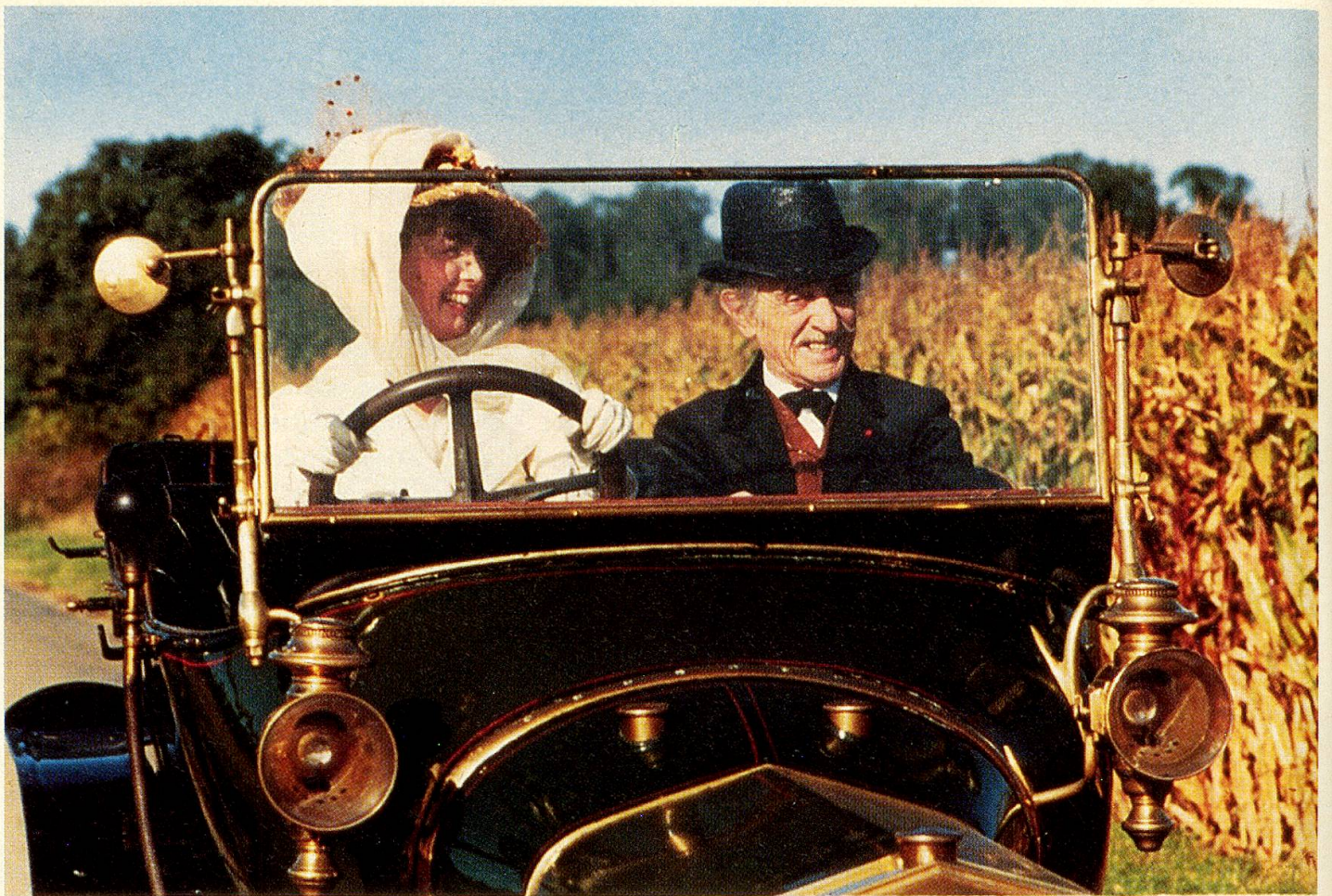
Der alte Maler wird von seiner Tochter mitgenommen in die neue Zeit.

Tanzen – bedeutet das nicht lieben und leben?