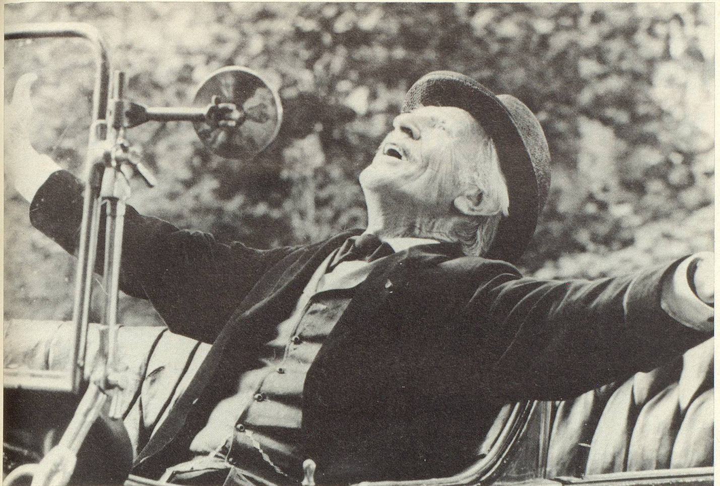
Wiedersehen mit dem Land der Erinnerungen.