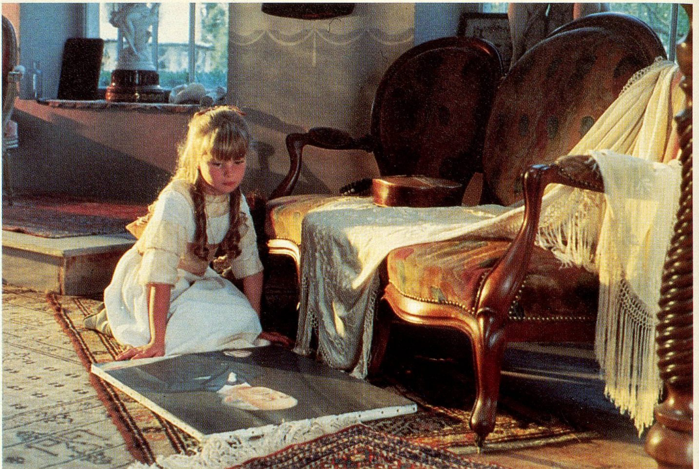
Bewunderung für das Schaffen des Grossvaters.