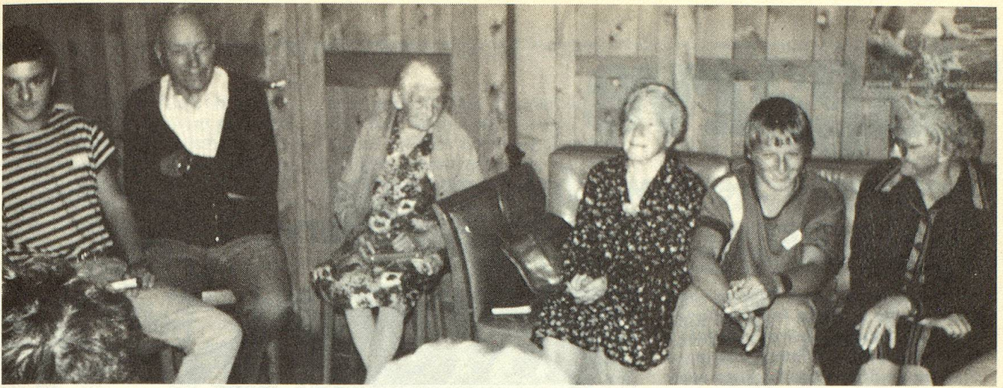
Die Spannung hat sich gelöst; aus schüchternen Gesprächspartnern wurde eine fröhliche «Tafelrunde».

Tempo anzupassen.» «Wir haben gesehen, dass alte Leute nicht langweilig sind, wie wir dachten.» «Ich habe den Kurs gewählt, damit ich alte Leute besser kennenlerne.» «Am Schluss gab es noch eine Diskussion über die Fehler der Senioren und der Jungen. Jetzt wissen wir, was wir aneinander falsch machen. Die kleinen Spielszenen haben mir auch gefallen.» «Ich sah diesem Kurs mit gemischten Gefühlen entgegen, einerseits freute ich mich, und andererseits wusste ich nicht, wie uns die alten Leute aufnehmen würden. Es freute mich, dass sie Vertrauen zu uns hatten und uns von ihren Sorgen und Problemen erzählten. Nach diesen drei Nachmittagen im Seniorenhöck habe ich das Gefühl, im Umgang mit alten Menschen Wichtiges gelernt zu haben.»